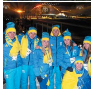
сайт Національного олімпійського комітету України.

Нагадаємо, що фестиваль триватиме до 18 лютого, а наші юні спортсмени змагатимуться за нагороди в семи з дев'яти видів спорту, які входять до програми змагань: біатлону, гірськолижного спорту, лижних перегонах, сноубордінгу, стрибках на лижах з трампліну, фігурному катанні та шорт-треку.