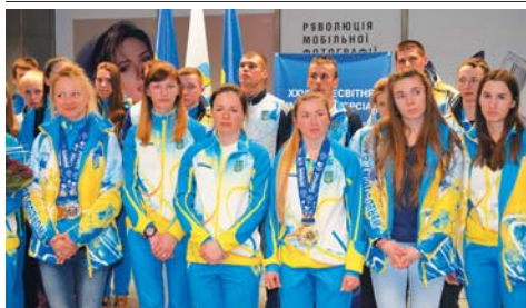
Зустріч української збірної в аеропорту «Бориспіль»