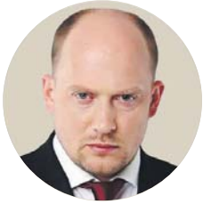
Сергій КАПЛІН, народний депутат України, представник профспілок у Верховній Раді України:

«Для соціальної справедливості зроблено кілька кроків, але, на жаль, це служба не влади, а передусім профспілок. Тільки завдяки послідовності профспілок нам вдалося досягти збільшення мінімальної зарплати. Але разом з тим, через незлагодженість і відсутність соціальної політики як такої сьогодні ми маємо взяти на себе зобов'язання з порятунку малого бізнесу. Ми запропонували законопроект, який дозволяє практично вдвічі зменшити розмір єдиного податку для другої групи підприємців – це майже 2 млн людей. Так само на часі – й цей крок буде справедливим – збільшення мінімальної пенсії до рівня прожиткового мінімуму – 3200. І ми будемо за це боротися».