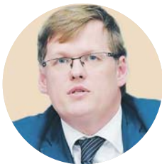
Павло РОЗЕНКО, віце-прем'єр-міністр України:

«Безумовно, тепер бізнесу доведеться замислитися. Адже людям офіційно виплачували тільки мінімальну зарплату, решту – в конверті. Ми хочемо таким кроком стимулювати бізнес, перевести в заробітну плату працівникам економію єдиного соціального внеску».