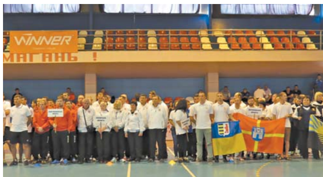
Команди-учасниці Всеукраїнської спартакіади держслужбовців.

У серпні на Олімпійських іграх в бразильському Ріо-де-Жанейро, нагадаємо, Микола Мільчев зупинився за крок від медалі, посівши четверте місце. Також саме Мільчеву була довірена висока честь та відповідальна місія нести прапор України на урочистій церемонії відкриття Ігор XXXI Олімпіади.