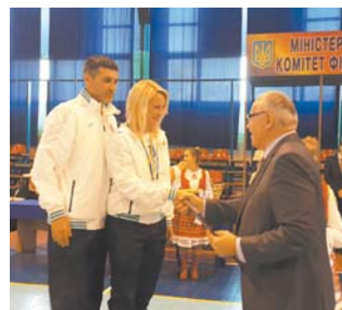
На церемонії вшанування медальстів

За підсумками усіх видів спартакіади перше загальнокомандне місце впевнено посіли державні службовці Хмельницької області (372 очки).