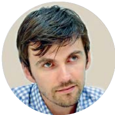
Павло КОВТОНЮК, заступник міністра охорони здоров'я:

«Українська держава інституційно не здатна регулювати діяльність приватних страхових компаній, як це роблять Швейцарія або Нідерланди. Тому це може призвести до того, що велика частина українців просто залишиться не застрахованою».