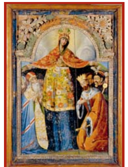
Тож Покрова відзначається у нас не тільки як народно-релігійне, а й як національне та державне свято.

кого султана, в еміграцію, взяли із собою й образ Пресвятої Покрови. Українська Повстанська Армія (УПА) теж обрала собі свято Покрови за день Зброї, віддавши під опіку святої Матері Богородиці. У сільському побуті Покрова, як писав український етнограф, письменник та фольклорист в еміграції Олекса Воропай, це був саме сезон на сватання та весілля, а тому дівки, яким уже надокучило дівувати, мотилися: «Свята мати, Покровонько, накрій мою головоньку, хоч ганчіркою, аби не зісталася дівкою». На Поділлі дівчата казали: «Свята мати, Покровонько, завинь мою головоньку, чи в шматку, чи в онучу – найся дівкою не мучу!» Господарі ж примічали погоду: якщо на Покрову вітер віяв з півночі, то це знак, що зима буде холодною і з великими снігами, а як з півдня – теплою.