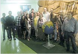
Єдина сила, що здатна очолити рух за справедливую заробітну плату, – це профспілки.

Тема семінару була присвячена визначенню глобальної цілі України та ролі профспілок у її досягненні, а формат заходу був побудований таким чином, що надав кожному з учасників можливість висловити свою думку з цього питання, щоб разом осмис-