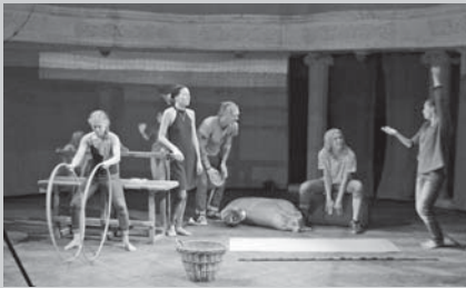
Актори на практиці досліджують, як минуле працює з нами, і як ми можемо працювати з минулим. Працювати так, щоб пережитою травмою не виправдовувати відсутність відповідальності

На фестивалі сучасного мистецтва «ГогольFest», що проходив 16-25 вересня на Арт-заводі Платформа в м. Києві, відбулася прем'єра польсько-української вистави, створеної у рамках польсько-українського перформативного проекту «Мапи страху / Мапи ідентичності» – «Мій дід копав. Мій батько копав. А я не буду».