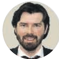
Андрій НОВАК, голова Комітету економістів України:

«Розмови про те, що зарплати підвищать, без розмов про демонополізацію та підвищення конкурентоспроможності – безпідставні. Тільки на основі якості праці, підвищення продуктивності можна розглядати питання зростання зарплат».