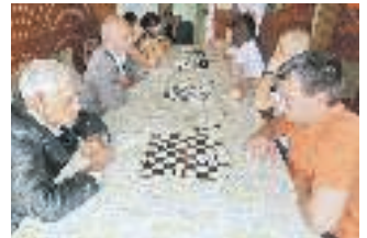
Змагання з шашок