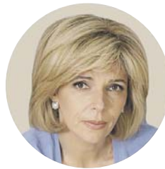
Ольга БОГОМОЛЕЦЬ, голова профільного комітету ВР:

«Проблема криється не в рекламі, а у відсутності контролю. Раніше в Міністерстві охорони здоров'я хоча б існував комітет, який розглядав макети реклами, мав можливість щось фільтрувати ще на вході. Минулоріч у МОЗ діяла робоча група, до складу якої входили представники Антимонопольного комітету, державної регуляторної служби, а також проєвропейські експерти».