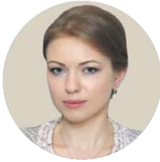
Олександра ПАВЛЕНКО, заступниця міністра охорони здоров'я:

«Проблема криється не в рекламі, а у відсутності контролю. Раніше в Міністерстві охорони здоров'я хоча б існував комітет, який розглядав макети реклами, мав можливість щось фільтрувати ще на вході. Минулоріч у МОЗ діяла робоча група, до складу якої входили представники Антимонопольного комітету, державної регуляторної служби, а також проєвропейські експерти».