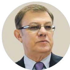
Володимир ЛАНОВИЙ, экс-міністр економіки, президент Центру ринкових реформ:

«Якщо при владі залишиться теперішній уряд з його методами роботи, то він буде змушений покривати дефіцит бюджету друкуванням гривні. Адаже грошей, на які сподівається Кабмін, не буде. Маю надію, що цей уряд не залишатиметься довго при владі і нові люди щось переглянуть і змінять».