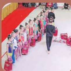
Продовження теми на стор. 16.