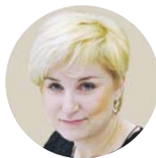
Наталія ЗЕМЛЯНСЬКА, голова Всеукраїнської профспілки виробничників і підприємців