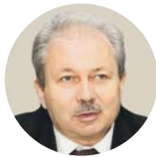
Сергій КОНДРЮК, заступник Голови Федерації професійних спілок України