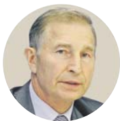
Григорій ОСОВИЙ, Голова Федерації професійних спілок України