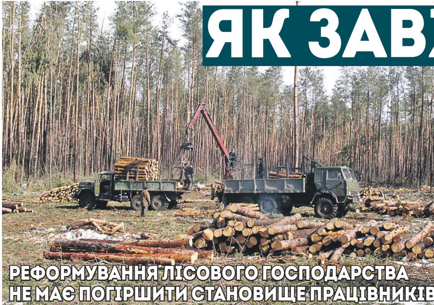
РЕФОРМУВАННЯ ЛІСОВОГО ГОСПОДАРСТВА НЕ МАЄ ПОГІРШИТИ СТАНОВИЩЕ ПРАЦІВНИКІВ

Актуальні питання реформування лісової галузі та заходи, яких потрібно жжити профспілкам задля ефективного захисту соціально-економічних прав та інтересів працівників галузі, обговорили учасники позачергового Пленуму Профспілки працівників лісового господарства України. В заході взяли участь і виступили голова Державного агентства лісових ресурсів України Олександр Ковальчук, заступник Голови ФПУ Сергій Українець.