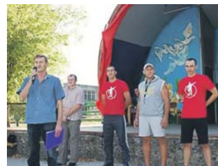
Урочисте звернення до присутніх

Досить цікавими й оригінальними виявилися конкурси шашки, квесту, презентації символіки зльоту, музичного домашнього завдання, буріме, інсценованої пісні тощо. Не менш видивними були змагання в легкоатлетичній естафеті, жіночому пенальті, футболі, волейболі. Завдання закритого виду спорту