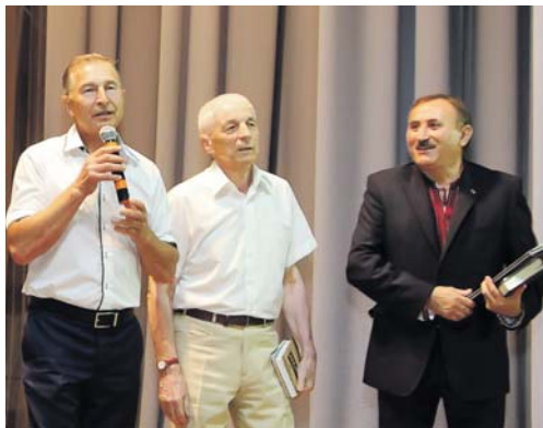
З вітальним словом виступає Голова ФПУ Григорій Осовий