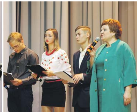
Першокурсників вітає ректор Академії Вікторія Буяшенко