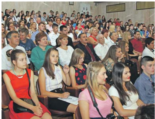
Посвята у студенти в Академії праці, соціальних відносин і туризму