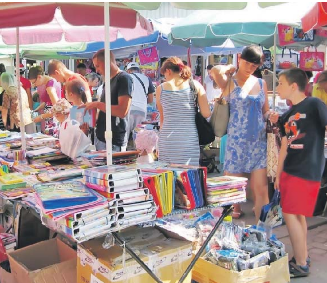
Скільки коштують цьогорічний першокласник?

від 250 гривень і вище. Якщо поверхню наплічника прикрашено вишивкою чи етнічним зображенням, треба було накинути ще хоча б 100 гривень за креативність авторів моделі. Навіть пенали вразили ціновим діапазоном. Найдешевший коштував 23 гривні, найдорожчий – 104. Або ж альбом для малювання – від 10 до 51 гривні.