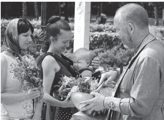
«Не забороняйте дітям приходити до Мене...» (Мр. 10, 14)