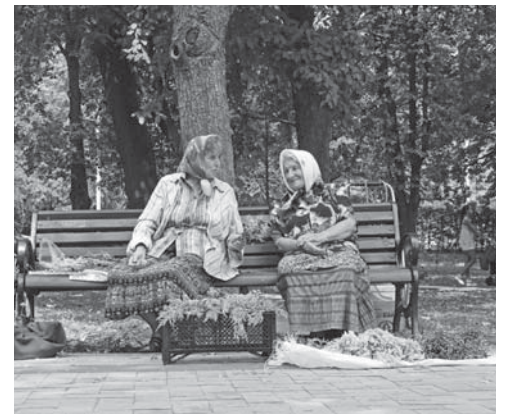
Кому – свято, а кому – просто бізнес