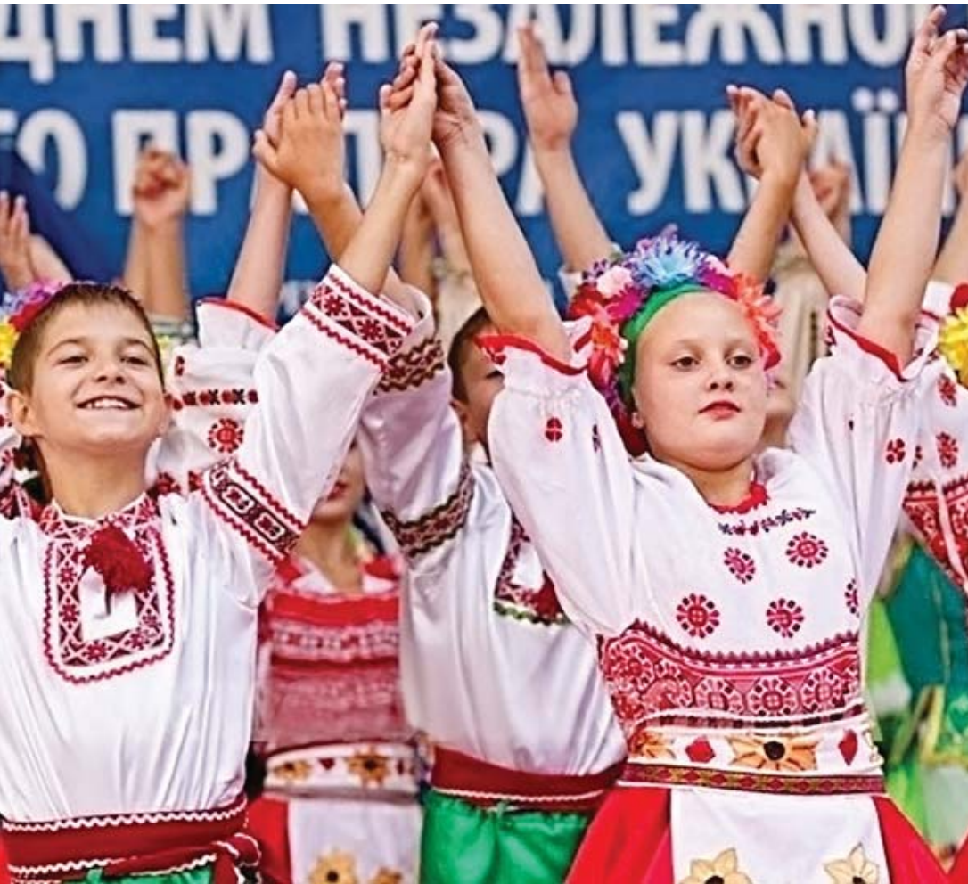
Святування Дня Незалежності

51,8% опитаних у 1991 році підтримали незалежність України, 30,7% – не брали участі в референдумі, 7,4% – проголосували проти незалежності та 10,1% опитаних не згадали свого рішення.