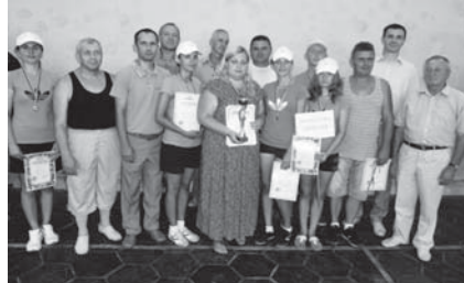
Переможець спартакіади команда Закарпатської дирекції УДППЗ «Укрпошта» разом з організаторами

XII обласна галузева спартакіада працівників Закарпатської дирекції УДППЗ «Укрпошта», у проведенні якої організаторам допомагала обласна рада ФСТ «Спартак», пройшла на центральному стадіоні м. Хуст. На старт цих захоплюючих змагань, де учасники боролися за першість у шести спортивних дисциплінах, вийшли представники всіх структурних підрозділів дирекції.