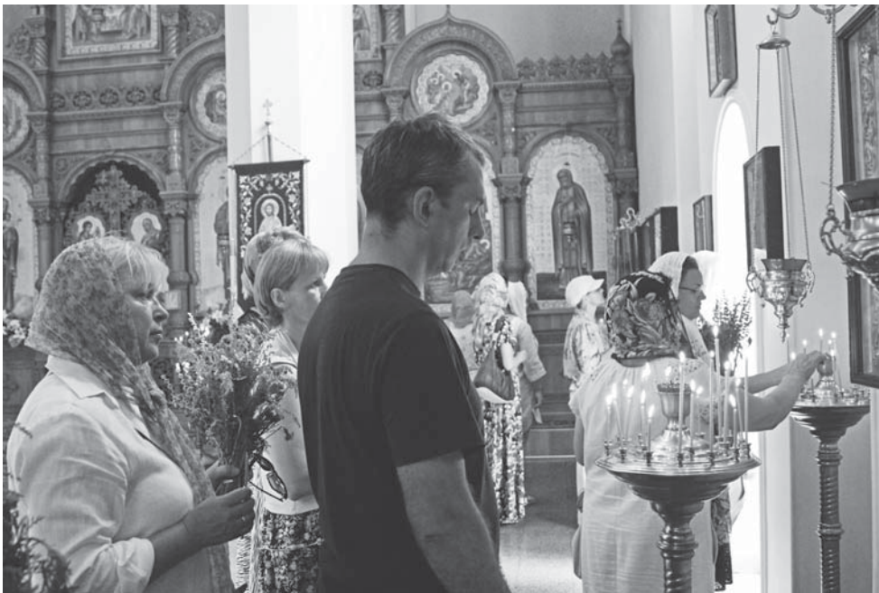
Маковія (також Перший Спас, Спас на воді, Медовий Спас) — народна назва православного свята Винесення чесних дров Животворчого Хреста Господнього, або Свято Всемилового Спаса та Пресвятої Богородиці (Вікіпедія)

Після обрядів всі прямують по домівках, адже традиційно цього дня печуть запавні пироги з маком. Тож не дивуйтеся, що увесь день вас переслідуватиме аромат свята – запах смачної випічки.