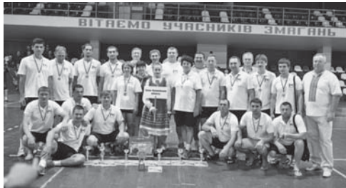
Команда Івано-Франківської області – переможець Всеукраїнської спартакіади в загальнокомандному заліку

У спортивному комплексі «Юність» вперше проходили змагання IV Всеукраїнської спартакіади серед депутатів обласних, районних, міських (міст обласного підпорядкування), сільських та селищних рад. У турнірі взяли участь 12 команд з різних областей України.