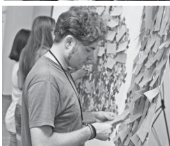
Основні права людини та її трудові права. Порушення прав – з одного боку, дотримання – з іншого. Згадайтеся, де і що розташовано