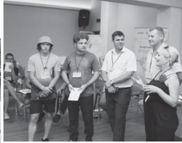
У політичній грі було все: від виборів мера до беззахатченків. Гра мала на меті змодельовати критичну ситуацію й побачити, до чого призведуть наслідки дій чи бездіяльності політичних і профспілкових сил