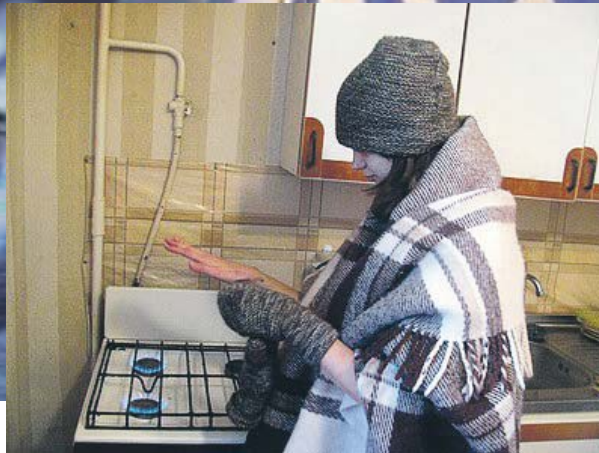
Є два сценарії подолати енергетичну кризу цієї зими: поганий і дуже поганий