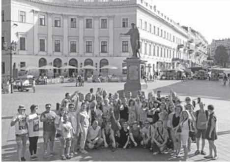
На екскурсії Одесою