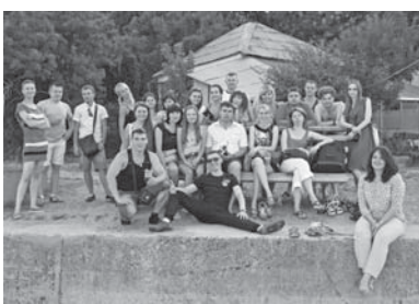
Посиденьки на березі моря під живу музику