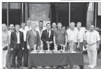
Члени оргкомітету спартакіади