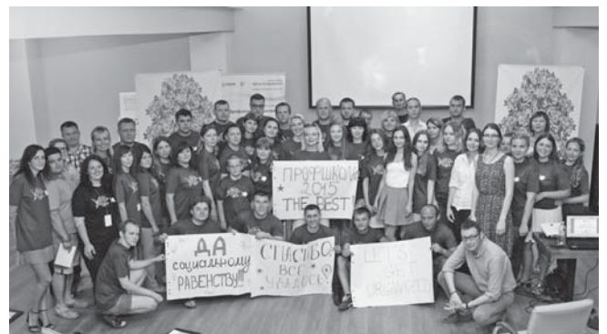
Фото на згадку