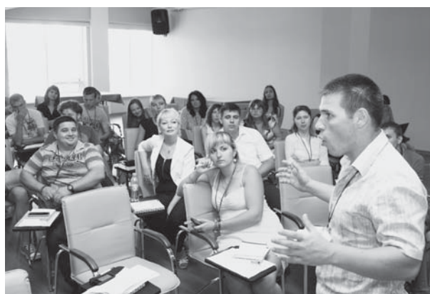
Дискусії та обговорення актуальних питань і завдань