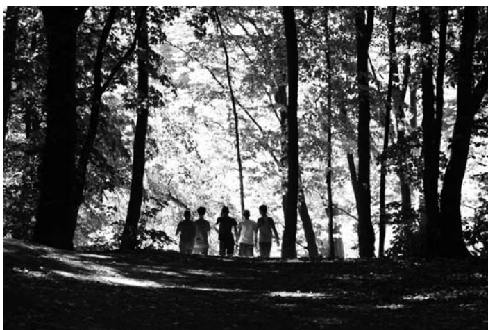
Розлоге гілля могутніх старих дерев