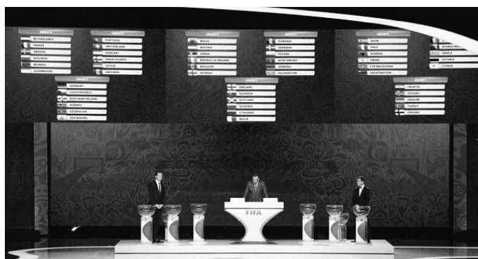
52 європейські збірні у складі 9 груп виборюватимуть путівки у фінальну частину ЧС–2018