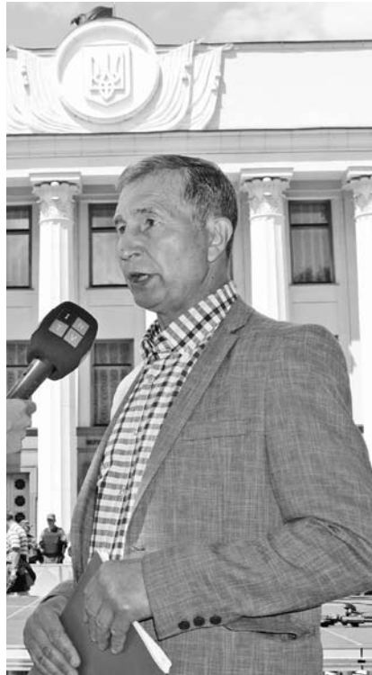
Основні економічні та соціальні показники, які мають увійти до проекту бюджету, розгляне Національна тристороння соціально-економічна рада.

Ми сприймаємо це позитивно, адже стан здоров'я багатьох громадян незадовільний, для виправлення цієї ситуації держава має за-