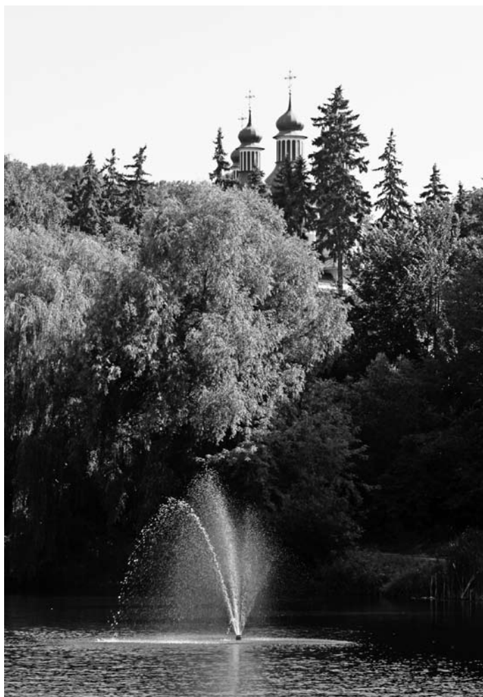
Фонтан вважають чудом природи – вода б'є просто з-під землі