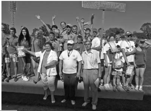
Переможці спартакіади у загальнокомандному заліку разом з організаторами

Незабутнім культурно-спортивним святом стала III обласна галузева спартакіада закладів культури Закарпаття, яка вперше проводилася в Ужгороді (попередні дві відбулися у Мукачеві). На старт змагань вийшли понад 350 учасників у складі 29 збірних команд працівників культури з міст і районів області, обласних установ – театрів, бібліотек, музеїв, філармонії, навчальних закладів культури тощо.