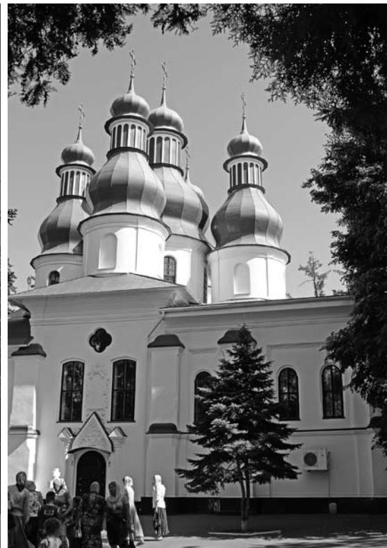
Свято-Троїцький Китаївський монастир