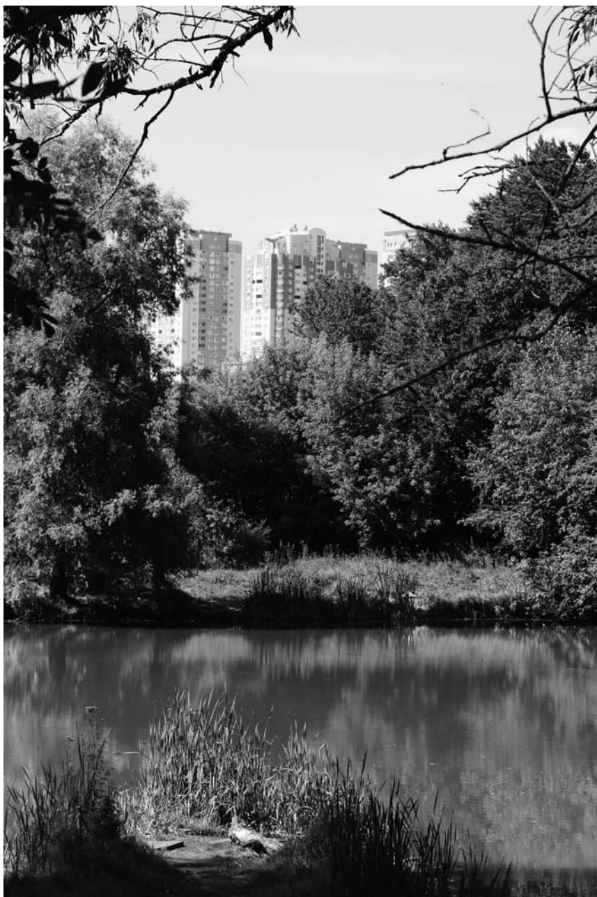
Клаптик дикої природи майже посеред мегаполісу