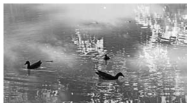
Дикі качки та чаплі – постійні мешканці цих місць