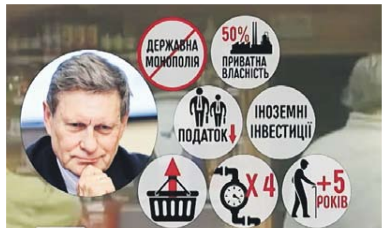
Стати успішною Польщі допомогли тотальні реформи

У результаті Польща зробила те, до чого прагнула. За рахунок ресурсів, які були в розпорядженні центральної влади, – фінансових, майнових, кадрових та інших, були збільшені ресурси місцевих влад. Окрім того, змінився територіальний устрій держави, стала більш ефективною система управління та бюджетного розподілу. Тепер польські партнери готові допомогти зробити те саме в Україні. І у більш короткі терміни.