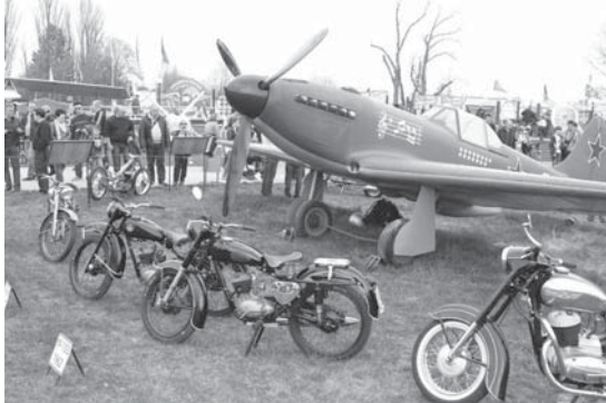
Ретротехніка поруч із літаками виглядає незвично