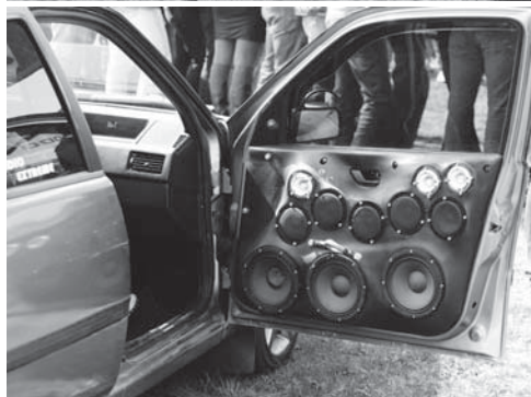
Змагаймося, у чіємү автoмобілі гүчніша мyзика!