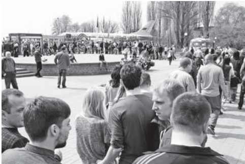
Черга, немов до мавзолею