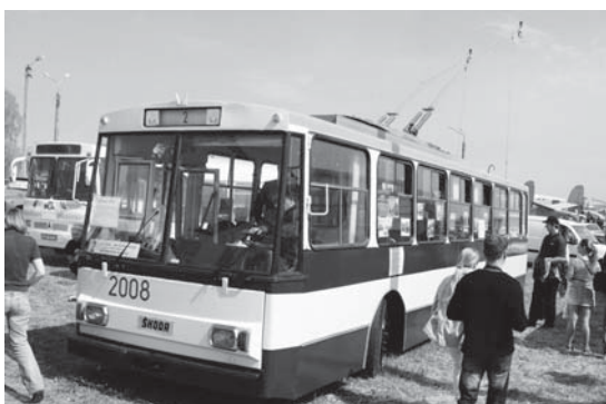
Ці «рогачі» досі їздять вулицями