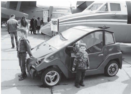
Електромобіль українського винахідника