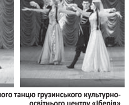
Ансамбль народного танцю грузинського культурно-освітнього центру «Іберія»