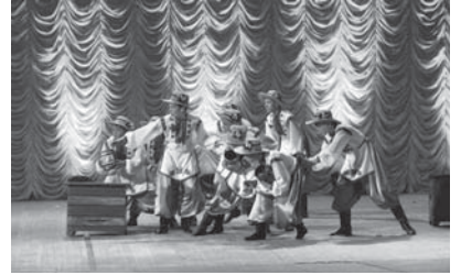
Виступає народний художній колектив ансамбль танцю «Вітамінчики»