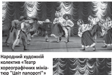
Народний художній колектив «Театр хореографічних мініатюр "Цвіт папороті"»