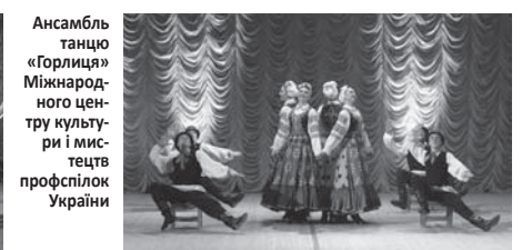
Ансамбль танцю «Горлиця» Міжнародного центру культури і мистецтв профспілок України