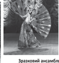
Зразковий ансамбль народного танцю «Росток»