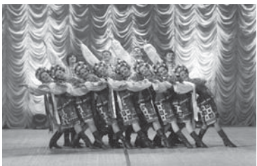
Народний ансамбль танцю України «Барвінок» Луганського обласного осередку Національної хореографічної спілки України