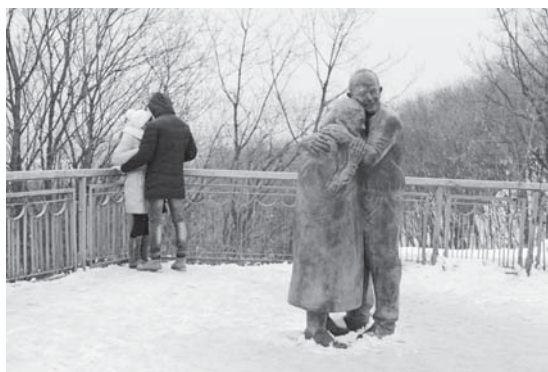
Минають віки, але нічого не змінюється під сонцем...