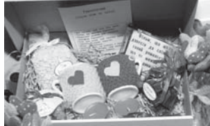
Романтичний набір для закоханих