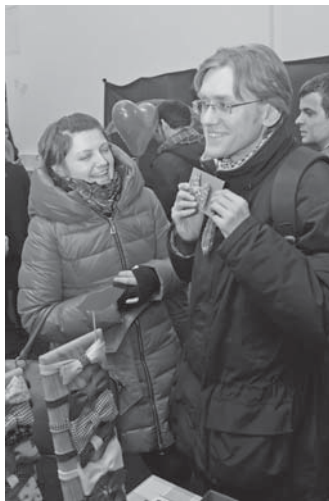
Гарний метелик – чудовий подарунок