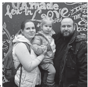
Фото на згадку