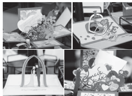
Чудові валентинки з побажаннями