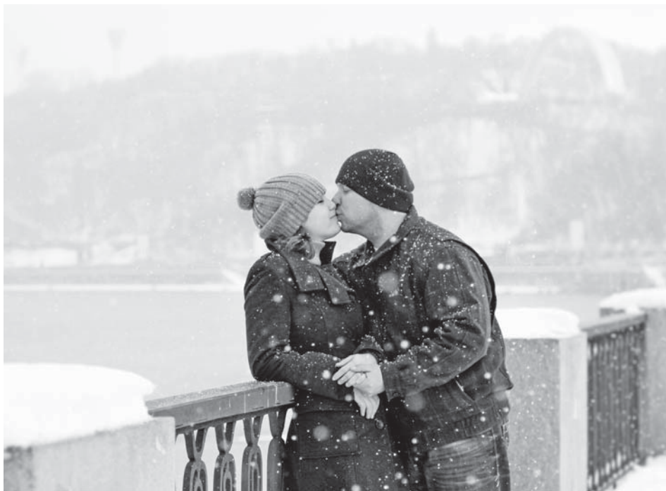
Мороз кохання не завада