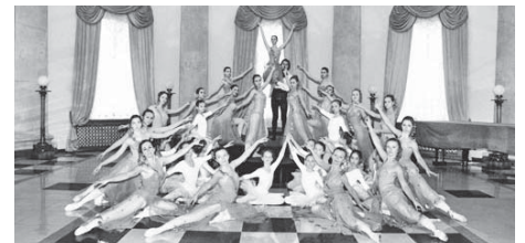
Народний ансамбль класичного балету «Просвіт»

Профспілки у своєму листі звертаються до Віталія Кличка з проханням врахувати позицію Федерації професійних спілок України в подальшій роботі з реалізації положень Указу Президента України та сподіваються, що цей процес проходить відкрито, прозоро та з урахуванням думки киян.