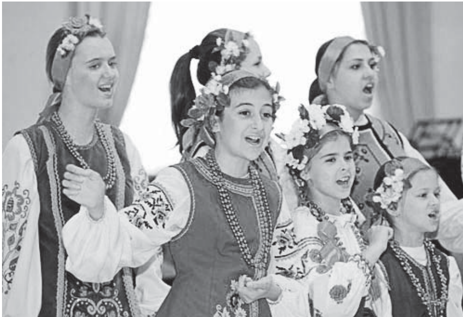
Співає дитячий фольклорний колектив «Співаночка»

Київський Міжнародний центр культури та мистецтв профспілок України (МЦКМ ПУ) знову опинився у центрі конфлікту. На базі Жовтневого палацу можновладці пропонують створити Музей Небесної Сотні, або Музей Майдану. З такою ініціативою виступили восьмеро депутатів Верховної Ради. Розглянувши можливі приміщення для реалізації своєї ідеї, вони обрали Жовтневий палац. Тож приміщення колишнього Інституту шляхетних дівчат, а нині – культурного центру профспілок може стати музеєм. Категорично проти цього виступає трудовий колектив.