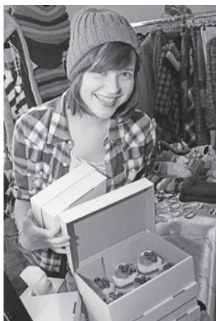
Дівчата знають, як знайти шлях до серця...

У будь-якому разі, я вважаю, що не варто чекати свята, аби зробити коханій подарунок чи зізнатися у своїх почуттях. Немає значення, що саме подарувати коханім. Якщо це робити постійно і без спеціальної нагоди, то навіть просто запашна кава із шоколадною цукеркою і теплими словами стануть гарним подарунком.