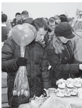
Хтось гарно підготувався