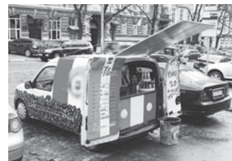
Справді, не перевелися ще першопрохідці