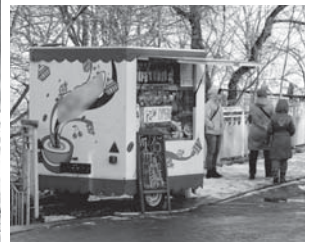
Відразу зрозуміло, чим тут пригощають