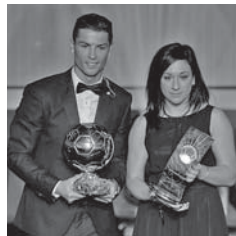
Під час церемонії вручення «Золотого м'яча»

го минулого року «Реал» триумфував у Лізі чемпіонів. Кращою футболісткою року стала німкеня Надін Кесслер. До символічної збірної 2014 року, склад якої оголосив Алессандро дель П'єро, потрапили воротар Мануель Нойер, захисники Філіпп Лам, Давид Луїс, Серхіо Рамос і Тьяго Сілва, півзахисники Андрес Ін'єста, Анхель Ді Марія і Тоні Крос, форварди Кріштіано Роналду, Ліонель Мессі та Ар'єн Роббен. Найкращим тренером в чоловічому футболі минулого року