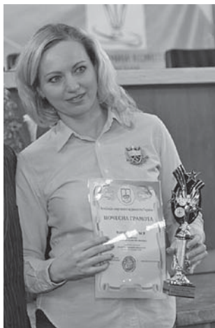
Володимир ПОЛІТАЄВ спеціально для «ПВ»

Ось уже в'ятнадцяте Асоціація спортивних журналістів України (АСЖУ) підсумовує спортивний рік, у визначенні кращих із кращих взяли участь 579 осіб. Також варто зазначити, що цього разу церемонія «Підсумки спортивного року» була присвячена й 15-літтю утворення організації, яка об'єднала спортивних «акул пера» 26 червня 1999 року.