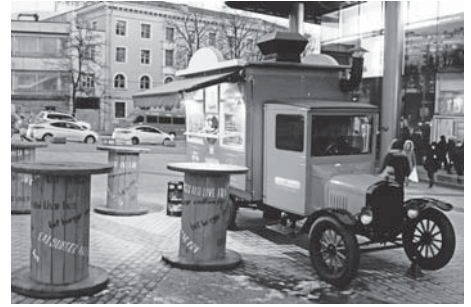
Чудовий старенкий автомобіль, біля якого хочеться не лише випити щось гарячого, а й перекусити