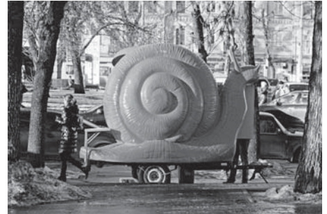
Ми обслуговуємо швидко