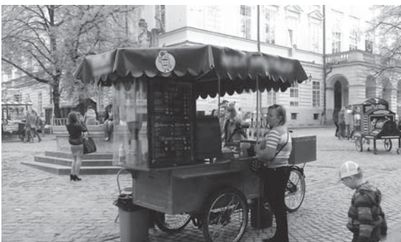
Львів. Завжди затишно і цікаво