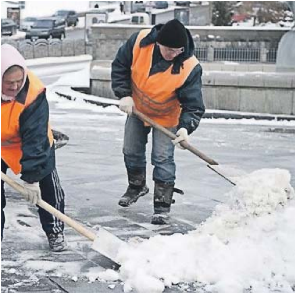
Зима, як завжди, прийшла зненацька...

Цього року з київського бюджету комунальному підприємству на закупівлю техніки для зимових робіт виділили понад 50 мільйонів гривень.