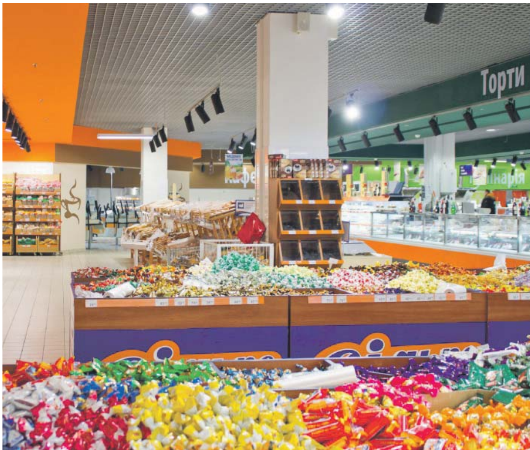
Частка продажу споживчих товарів, вироблених на території України, у структурі роздрібного товарообігу становить 59,9%

лочній продукції становить 20–25%, у соняшниковій олії – до 33, у ковбасах – 10–15%. Йдеться про замітники чи не якісні добавки.