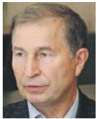
Григорій ОСОВИЙ, Голова Федерації профспілок України:

«Для створення в Україні соціально справедливої, демократичної, правової держави, безумовно, необхідно підвищувати ефективність соціального діалогу. Профспілки у визначенні соціального діалогу дотримуються формули, виробленої Міжнародною організацією праці. За цією формулою, є три учасники соціального діалогу: профспілки, роботодавці й Уряд. Всі решта, хто бере участь у процесі, за цією класифікацією, є учасниками громадянського діалогу. Ми вважаємо, що вони або включаються в соціальний діалог за формулою «три плюс», або це громадянський діалог, коли будь-які громадські організації створюють пул якихось неформальних структур чи рухів і які вже ведуть діалог з будь-якої конкретної теми. Профспілки, безумовно, можуть бути учасниками такого громадянського діалогу, тому що вони діють у сфері праці, тобто, образно кажучи, починаючи від навчання та професійної підготовки працівників до пенсійного забезпечення – це все сфера інтересів профспілок. Так виписані всі національні законодавства, так МОП побудувала свою роботу. Тому коли ми говоримо про реформування соціального діалогу, ми маємо пояснити, чого цим намагаємося досягти: розширити сферу його учасників чи «докапіталізувати» учасників інструментами роботи, щоб вони були дієвими, щоб був не тільки механізм, а й результат.