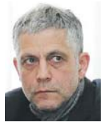
Міністерства соціальної політики та НАН України, виконавчий директор Бюро соціальних і політичних розробок:

«Сьогодні перед профспілками і громадськими організаціями постає проблема, коли всі стратегічні державні документи не передбачають профспілкової участі в реформуванні соціальної політики. Також не враховуються інтереси соціальних груп.