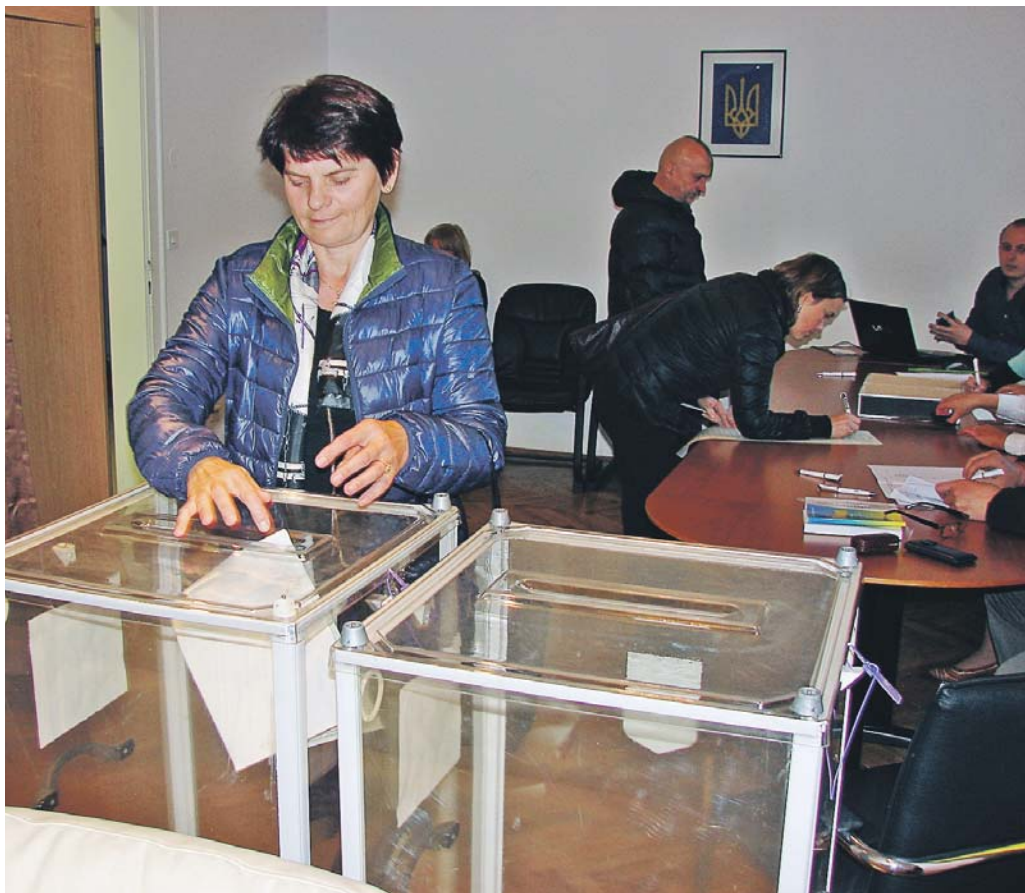
Явка на вибори цього року склала не більше 52%

на Президентів і партії, яка посідає перше місце на цих парламентських виборах». І додав, що до участі в перемовинах про створення коаліції запрошуються інші учасники перегонів, за винятком «Опозиційного блоку».