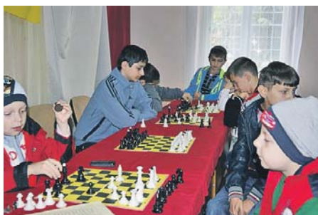
«Кубок «Севлюша» триває...

Першій річниці роботи однойменного шахово-шашкового клубу був присвячений турнір «Кубок «Севлюша»» серед кращих юних спортсменів Виноградівського та сусіднього Іршавського районів Закарпаття, учасниками якого стали понад 40 школярів – шанувальників цих інтелектуальних ігор.