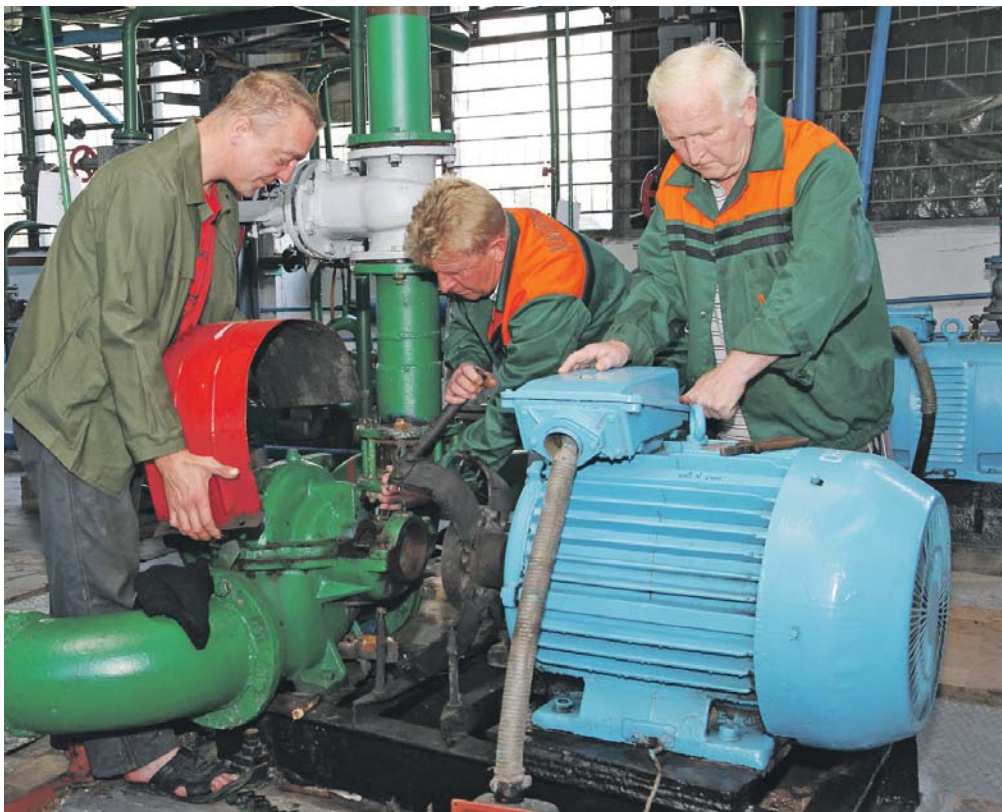
Незалежні експерти розрахували мінімальну заробітну плату в Україні, що має становити не менше 3 тис. грн

Середньомісячна заробітна плата в Україні за 2013 рік становила 3265 грн (320 дол. США). Для порівняння: в Польщі – 1380 дол., Чехії – 1460 дол., Франції – 2500 євро, Німеччині – 2800 євро.