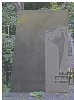
...опера співачка Зоя Гайдай