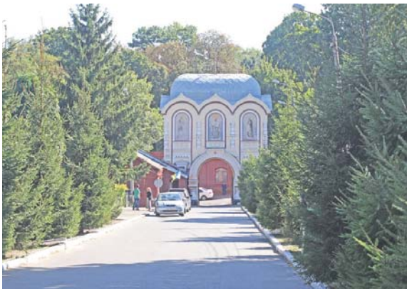
Центральний вхід і церква Св. Дмитрія