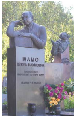
...композитор Ігор Шамо