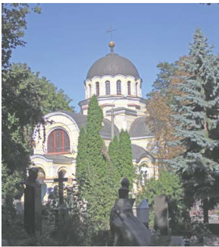
Вознесенська церква, закладена 1884 року