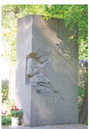
...архітектор Володимир Заболотний, автор проекту будинку Верховної Ради