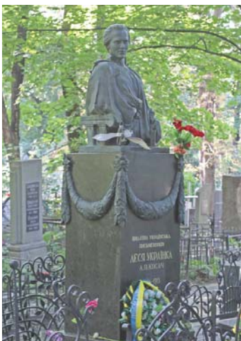
...видатна українська письменниця Леся Українка

Хоча Байкове кладовище й не може зрівнятися з відомим Личаківським у Львові, але й тут, звичайно, є на що подивитися. Прогулюючись численними алеями, тут можна побачити безліч склепів та пам'ятників, що являють собою справжні шедеври архітектурного мистецтва, поховання найвідоміших діячів політики, літератури, мистецтва, воєначальників та ін.