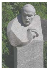
...письменник, драматург Михайло Стельмах