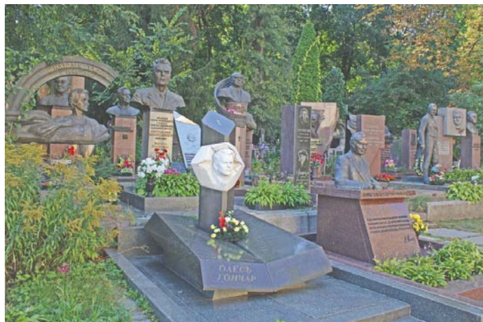
На передньому плані – могила класика української літератури Олеса Гончара, зліва – Наталії Ужвій, відомої української акторки. На Байковому поховано багато відомих людей, як-от: