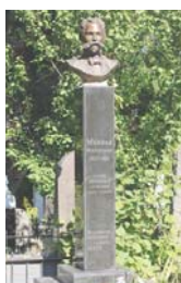
...ідеолог української державної самостійності Микола Міхновський