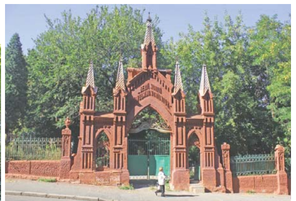
Вхід до католицької частини кладовища