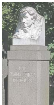
...корифеї українського театру Марія Заньковецька та Микола Саксаганський