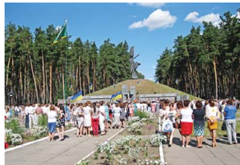
Зранку біля Меморіалу Слави відбувся мітинг, присвячений ювілею