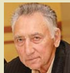
СЕРГІЙ ШИШОВ, голова Профспілки працівників енергетики та електротехнічної промисловості України:

«Сьогодні машинобудування, як і вся Україна, перебуває у вкрай важкому стані. Вам відомо, що частина підприємств галузі була орієнтована на експорт до Росії, а тепер доводиться шукати шляхи, аби переорієнтувати виробництво. Також маємо неабияку проблему з виплатою зарплат, їх суттєвим скороченням. Неможливо вирішувати питання виключно за рахунок трудящих – потрібен зважений підхід, а не наступ на фонди соціального страхування і соціальні гарантії. Але життя в Україні триває, і я сподіваюсь, що все буде добре».