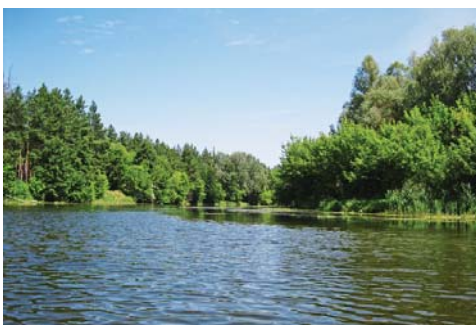
Тихий мальовничий Псьол – улюблене місце відпочинку лебединців

Лебедин – чарівний куточок України, барвіста квітка Слобожанщини. Неповторні краєвиди чудової української природи, привітні люди, цілюще повітря і напрохуд спокійна і затишна атмосфера раз і назавжди зачаровують кожного, хто хоча б одного разу побував на цій благодатній землі.