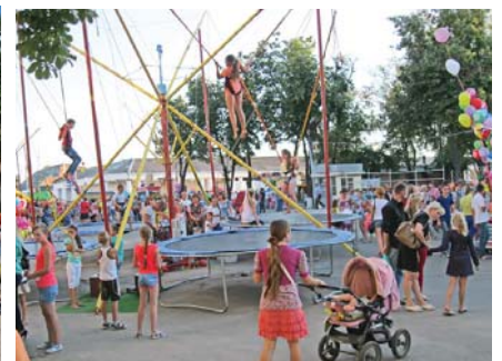
На центральній площі міста розважалися діти