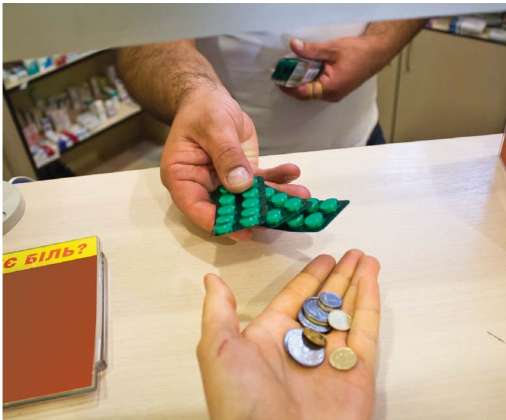
Із коштів, закладених у бюджет МОЗ, 80% витрачаються на заробітну плату і тільки 7% – на медикаменти