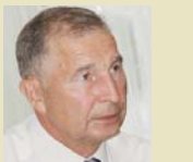
ГРИГОРІЙ ОСОВІЙ, Голова ФПУ:

«Пропозиції профспілок з питань економічного і соціального захисту законодавці здебільшого не враховують або ж ігнорують. І тому об'єктивно сьогодні ми не маємо можливості представити свою позицію у Парламенті України. Так склалося, що це переважно роблять бізнес і влада, відтак не чути голосу трудового народу. Тому приймаються рішення, що не завжди відповідають правам та інтересам трудової людини, або ущемляють ці права, надто останні доволі радикальні рішення щодо підвищення цін, заморожування зарплати тощо... Президія ФПУ рекомендувала членським організаціям ФПУ визначитися зі своєю участю в нинішньому виборчому процесі. Цілком очевидно, що більш ніж третина спілчан уже мають чітку позицію з цього питання і бажують брати участь у передвиборчому марафоні. Ті, хто братимуть активну участь у цій роботі, дістануть необхідну солідарну підтримку. За результатами обговорення члени Президії ФПУ однозначно зійшлися на тому, що у майбутньому профспілки повинні мати своє профспікове лобі в Парламенті, адже замість них ніхто не вирішуватиме проблеми трудівників».