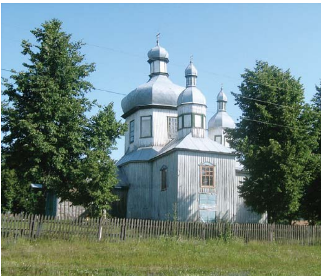
Воскресенська церква – пам'ятник архітектури національного значення – найдавніша церква Слобожанщини, єдина на Лівобережній Україні, побудована з дерева без жодного гвіздка