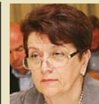
ВІКТОРІЯ КОВАЛЬ, голова Профспілки працівників охорони здоров'я України:

«У Луганській та Донецькій областях у енергетиці – повний провал. Пів-Донбасу перебуває без електрики. В ході АТО підірвані високочастотні опори і для того, аби їх відновити, потрібно направити туди ремонтні бригади. Але місцевість постійно обстрілюється, тож ситуація надзвичайно складна... Загалом катастрофічне падіння економіки позначається і на нашій галузі. Та все одно маємо працювати в цьому напрямі».