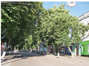
Чепурні будинки, широкі вулиці, обсажені тополями, каштанами і кленами, створюють особливий затишок