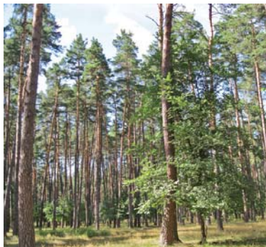
Місто оточене сосновими борами, багатими на гриби та ягоди