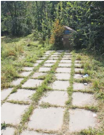
Плита майже повністю заросла кущами