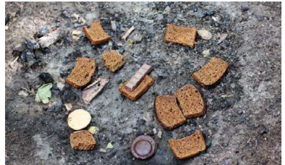
Попелище від багаття, на якому приносили жертву або дарунки у вигляді хліба, печива та шоколаду