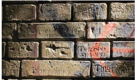
Деяким написам на цеглі дуже багато років