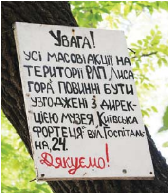
На деревах можна побачити таблички з проханням попереджати про будь-які масові акції