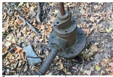
Ось такі колодязі та металеві труби трапляються тут на кожному кроці

Проте одна річ дослухатися до різних теорій і думок, розпитувати старожилів про цю місцину, а інша річ – побачити все на власні очі.