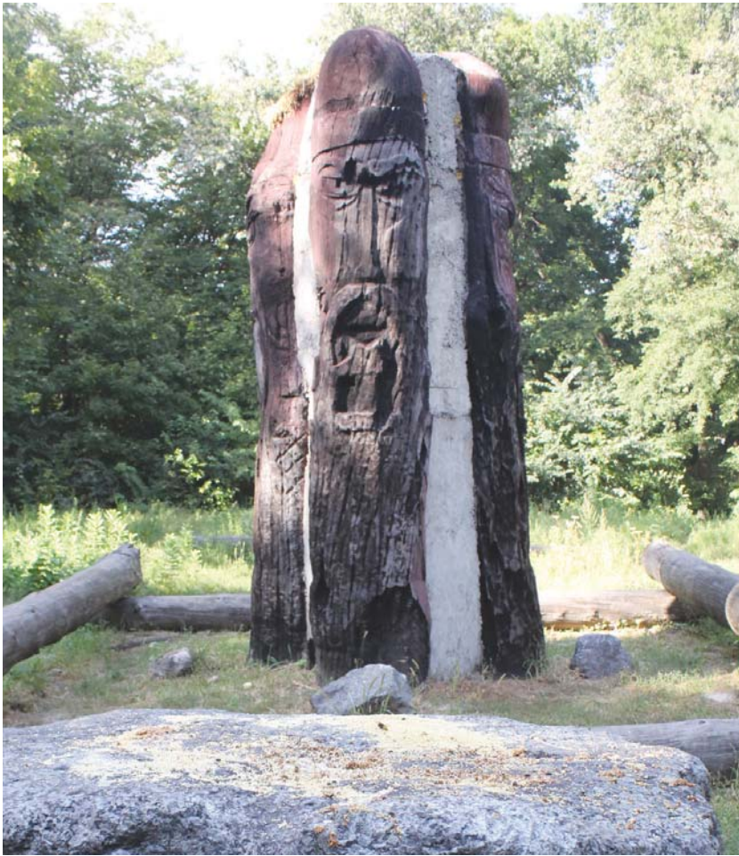
Місце поклоніння та камінь, на якому приносять дари у вигляді хліба, зерна та солодощів. Може, вночі дари геть інакші... Хтозна...