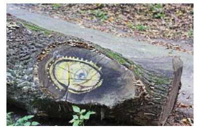
На спилі дерева біля стежки намальоване око