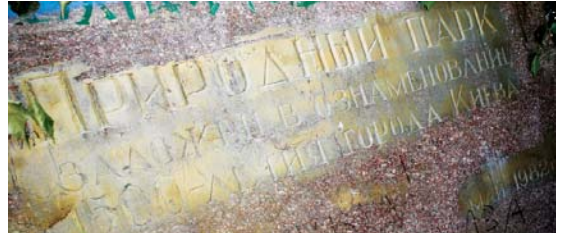
Гранітна плита, на якій читаємо: «Природний парк, заснований на честь 1500-річчя Києва»