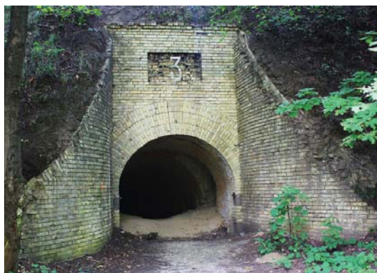
Одна із споруд, на якій я натрапив. Тут таких декілька і кожна з нумерацією над входом