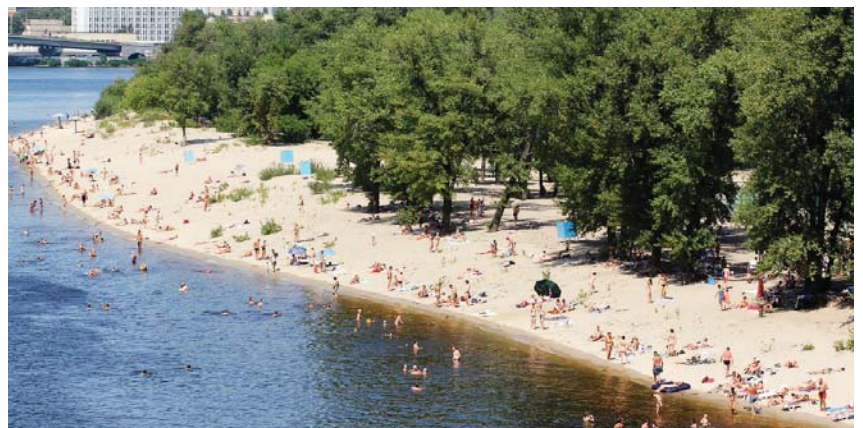
Труханів острів вабить тих, хто прагне усамітнення