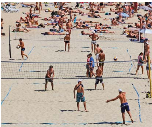
Волейбол на піску зближує