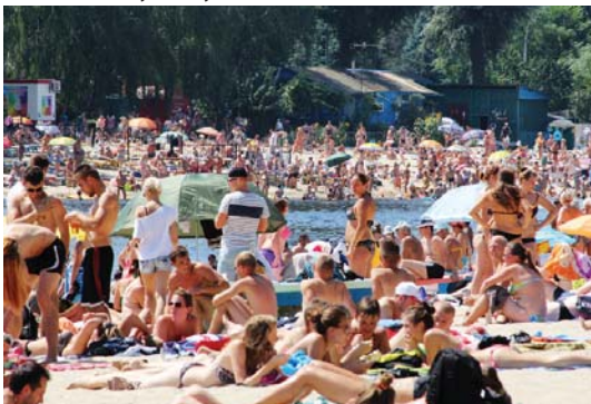
У Гідропарку вже із самого ранку ніде яблуку впасти