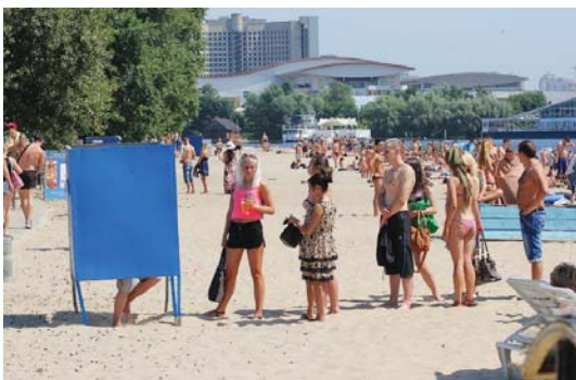
Майже як до Мавзолею...