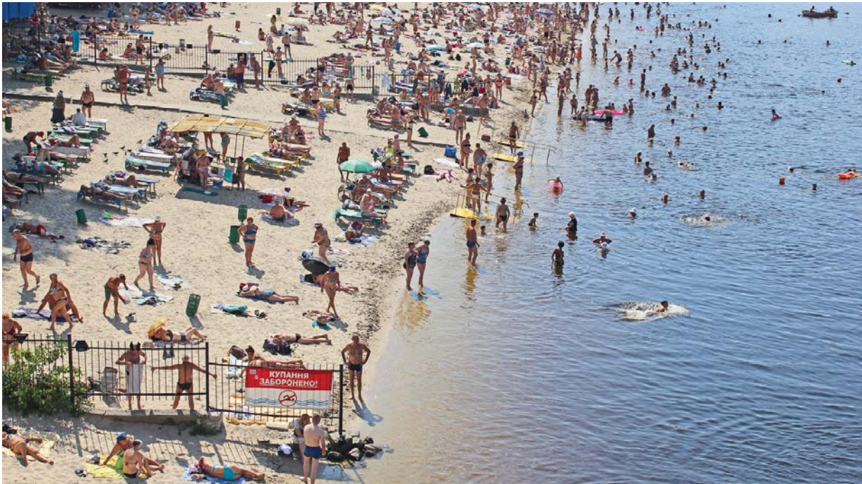
Попри плакат на паркані спека бере своє...