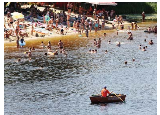
Човни з рятувальниками є біля кожного пляжу

Судячи з кількості відпочивальників на київських пляжах, чимало людей обирають саме такий відпочинок. Адже вартість омріяних закордонних подорожей до моря останнім часом надміру зросла, тож цьогоріч люди рятуються від задухи міських кварталів на берегах Дніпра. Найбільш облаштовані для пляжного вікенду й, що не менш важливо, безкоштовні для відвідувачів території Центрального пляжу на Трухановому острові, в Гідропарку та парку Дружби народів, на Березняках, у Пушці-Водиці. До того ж, тут до послуг відпочивальників – різноманітні кафе, розважальні заклади для дорослих і дітей, атракціони і ігри.