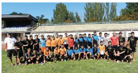
Переможці та призери змагань

Перемогу в змаганнях виборювали юнаки 2000 року народження, учні позашкільних навчальних закладів Всеукраїнського фізкультурно-спортивного товариства «Колос» АПК України. Загалом за нагороди турніру змагалися 10 команд із шести областей України.