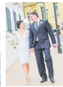
Узвіз живе своїм життям