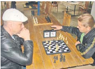
За шаховою дошкою