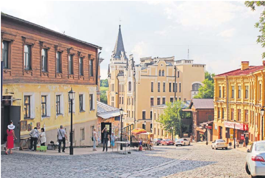
Старі будівлі Андріївського узвозу