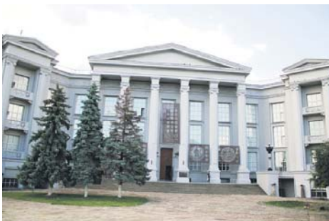
Національний музей історії України

Андріївський узвіз іще називають вулицею-музеєм, адже тут чимало пам'ятників архітектури, багато музеїв і мистецьких галерей, славнозвісна Андріївська церква. Тут також безліч затишних кав'ярень на будь-який смак, які радо відчиняють перед вами свої двері. Як приємно сидіти на терасі кафе і смакувати запашною кавою, з цікавістю спостерігаючи за перехожими. Особливу емоційну атмосферу створює вулична музика. Не дивно, що наречені приїздять сюди на першу спільну фотопрогулянку. Тож не гайте часу – приходьте на Андріївський узвіз, аби з користю провести вільний час і відпочити душею.