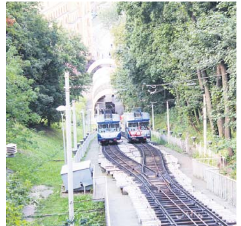
А після неспішної пішої прогулянки Андріївським узвозом можна проїхатися фунікулером, який з 1905 року возить киян із Подолу до Верхнього міста і навпаки