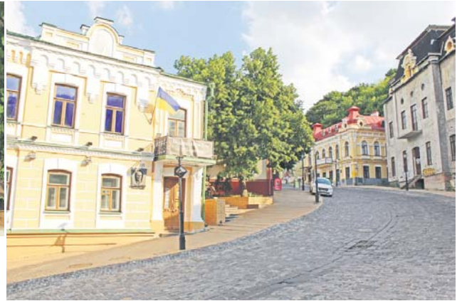
Ця вулиця пам'ятає Михайла Булгакова