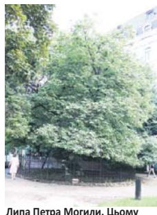
Липа Петра Могили. Цьому дереву близько 400 років