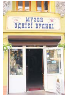
Музей однієї вулиці