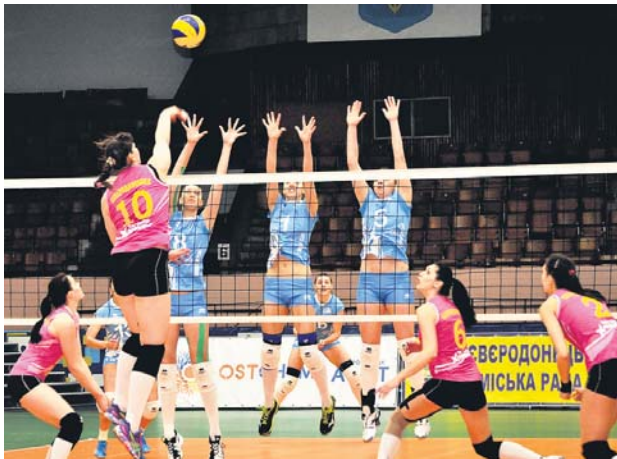
Чемпіон визначився у протистоянні «Хіміка» та «Северодончанки»

Северодончанки були надзвичайно вмотивовані, адже прагнули піднести землякам дорогі подарунки до 80-річчя свого міста, що відзначається наприкінці місяця. Зре-