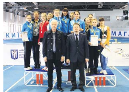
На п'єдесталі пошани – призери командних змагань у жіночій шпazi