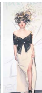
Перше місце «Дольче Габанна», перукарське мистецтво