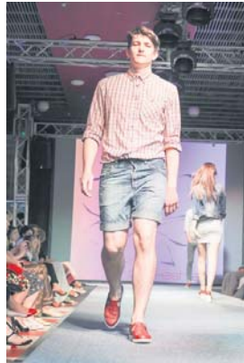
Перше місце «Wantital», номінація «Прет-а-порте», конкурс «Взуття та аксесуари»