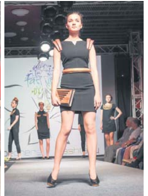
Перше місце «Woodline», номінація «Аксесуари», конкурс «Взуття та аксесуари»