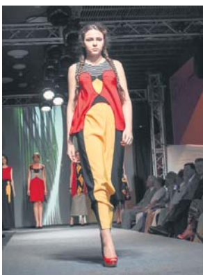
Третє місце «Подільська писанка», номінація «Фолк», конкурс «Одяг»