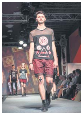
Перше місце «Folk Law», номінація «Фолк», конкурс «Одяг»