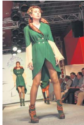
Перше місце «Крила часу», номінація «Прет-а-порте», конкурс «Взуття та аксесуари»