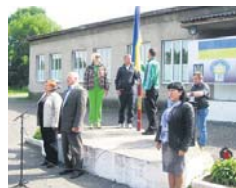
Урочисте відкриття спартакіади в с. Буштино Тячівського району

спортивної боротьби, продемонструвавши високу майстерність, право виступати у фінальній частині спартакіади завоювали переможці всіх чотирьох зон: у міні-футболі – Тячівського, Виноградівського, Волецького та Ужгородського районів, у жіночому волейболі – міст Хуста, Мукачеве,