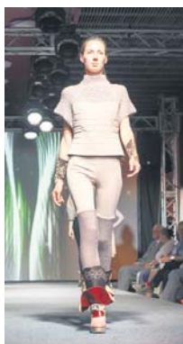
Друге місце «Motives de Versailles», номінація «Кутюр», конкурс «Взуття та аксесуари»