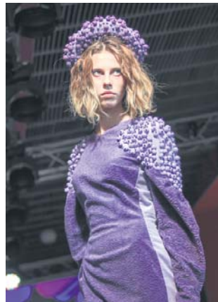
Перше місце «North magic», номінація «Де Люкс», конкурс «Одяг»