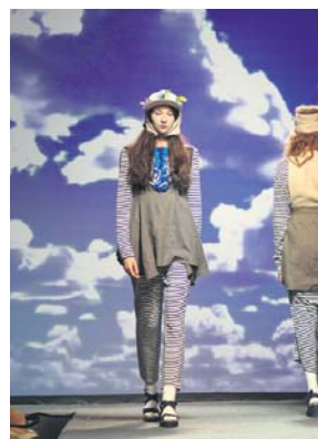
Друге місце «Sky and sand», номінація «Прет-а-порте», конкурс «Одяг»