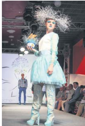
Друге місце «Diamonds in the sky», номінація «Прет-а-порте», конкурс «Взуття та аксесуари»