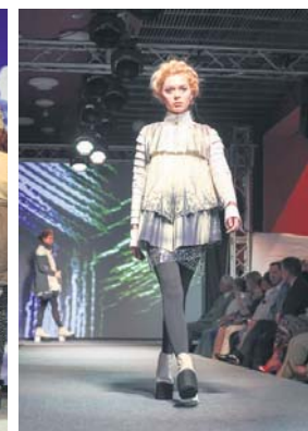
Перше місце «In fog», номінація «Прет-а-порте», конкурс «Одяг»