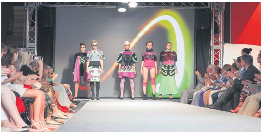
Друге місце «Ідол», номінація «Фолк», конкурс «Одяг»