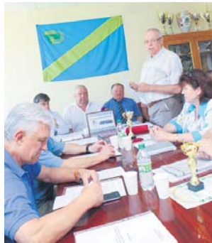
Підбиття підсумків роботи Київського міського ФСТ «Україна» за 2013 рік