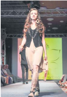
Третє місце «Живіє картини», номінація «Прет-а-порте», конкурс «Взуття та аксесуари»