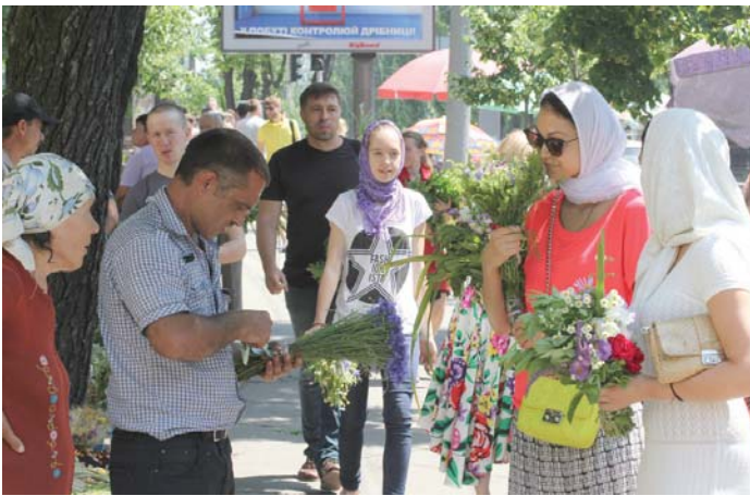
Для когось свято – гарний заробіток