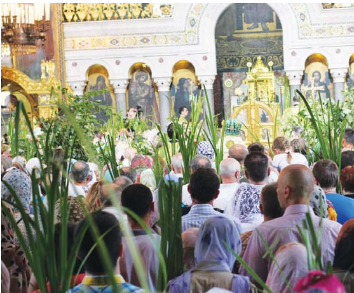
На Трійцю у церкві велелюдно