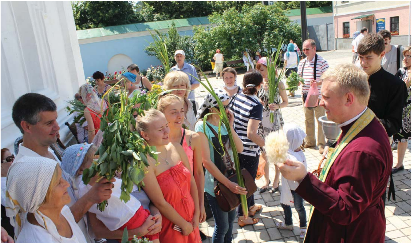
Пріємна освята спекотного дня...