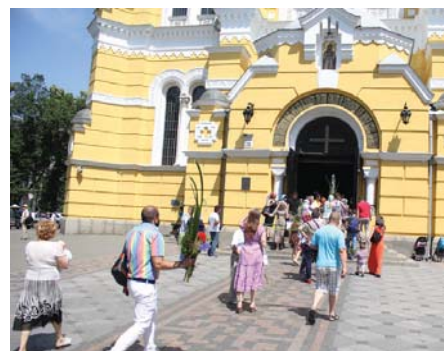
Люди поспішають до церкви, аби освятити зелень

Сьогодні Трійцю разом з іншими релігійними святами відзначають більш символічно – на 50-й день після Великодня, або П'ятидесятниці. Трійця завжди була одним з найбільш очікуваних свят для українців, а деякі традиції її святкування беруть свій початок ще з дохристиянських часів. Цього дня також поминають померлих рідних. Ну й, звичайно, відпочивають на природі, ходять у гості, відвідують рідних та друзів. Головне – не забувати про релігійне значення цього свята.