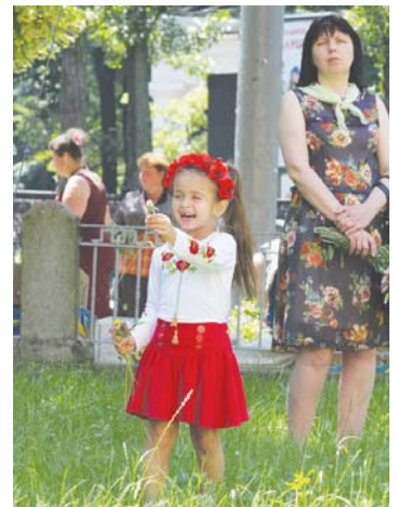
Малечі найцікавіше самій назбирати букет із зелених та квітів

У давнину наші прадді зустрічали Трійцю дуже урочисто. Впоравшись зранку з господарськими справами, люди вбиралися у святковий одяг і йшли до церкви. Кожна дівчина за давнім звичаєм несла в руках свіжі квіти та зелень. Після служби зазвичай відбувався хресний хід до криниць, щоб освятити їх, окропивши свяченою водою. У деяких місцевостях освячували таким самим способом оселі та господарські будівлі – для захисту від усіялої нечисті. У Трійці є ще одна назва – Зелені свyтки, оскільки цього дня прийнято прикрашати будинок ароматним зіллям, квітами і свіжою зеленню. Основа обрядності – культ рослинності, що цієї пори починає розквітати та визначає календарний початок літа. В Україні ще в XVIII столітті до церкви приносили обережки зелених трав, усередину яких ставили потріпну свічку, що називалася Тройцею, яка мала горіти протягом усієї обідні. Опісля ці трави використовували як оберег від різних хвороб, а свічку давали в руки вмираючому.