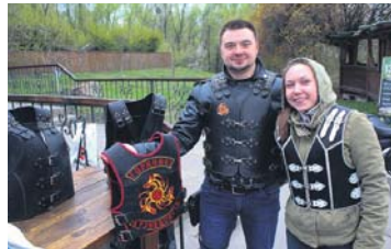
Жилети для справжніх любителів швидкості та їхніх дівчат