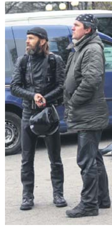
Хтось має більше грошей, хтось менше, та мріяти нікому не заборониш