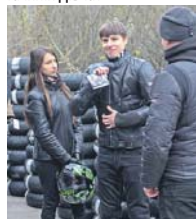
Аксесуари на будь-який смак