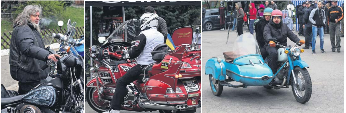
Хоч і різні, але однаково привертають увагу