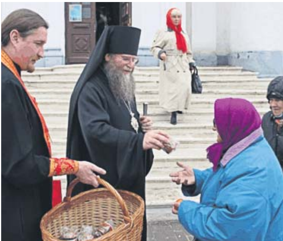
Рівень абсолютної бідності в Україні становить близько 13%

Із сімейного бюджету на харчування найменше виділяють у Люксембурзі (8,8%), Великобританії (9,1%) та Швейцарії (9,6%). Мешканці Німеччини змушені витратити на їжу 12,1% доходів, французи – 15,9%. Українці на їжу та безалкогольні напої віддають 50,2% своїх доходів.