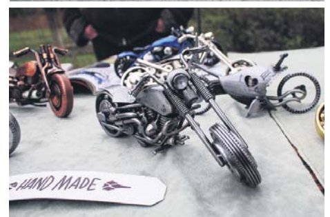
Навіть для малечі знайшлися цікаві речі