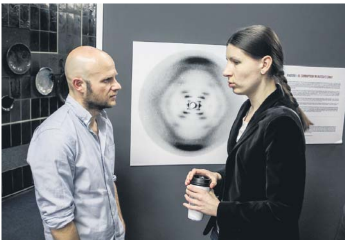
Автор виставки – Михайло Фрідман. Проект «Фото 51: чи прописана корупція в ДНК Росії?»

Відкриття фестивалю в Будинку кіно зібрало численних шанувальників цього виду мистецтва, тож глядацький зал був у центрі заповнений охочими долучитися до високого кіно. Крім того, в рамках Docudays UA представлені кілька фотопроектів, присвячених правам людини, зокрема «Фото 51: чи прописана корупція в ДНК Росії?», «Обличчя свободи. Майдан».