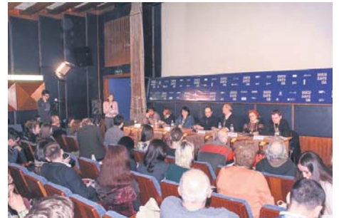
Прес-конференція журі фестивалю

От і настав тиждень документального кіно та фотовиставок, а той, хто відвідав цей фестиваль, я впевнений, отримав безліч вражень та неабияке задоволення. Майданчики показу – столичний Будинок кіно, кінотеатри «Кінопанорама» та «Київ». З 21 по 28 березня відвідувачі також мають можливість поспілкуватися з авторами й обговорити свої враження від переглянутих картин, яких, до речі, не один десяток. Це стрічки режисерів з різних країн світу, в яких втілено життєві та правові проблеми суспільства.