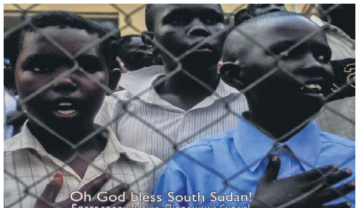
Кадри з фільму «Тренер Зоран і його Африканські тигри» режисера Сема Бенстеда