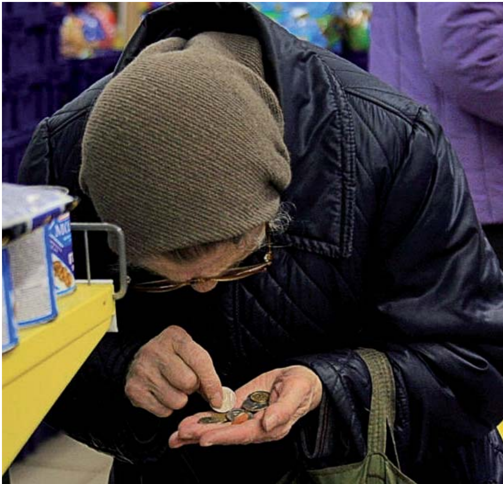
Режим жорсткої економії, запропонований урядом, у першу чергу позначиться на простих громадянах

Станом на лютий 2014 року, залишок коштів на Єдиному казначейському рахунку становив 4,3 млн грн, при тому, що несплачені платіжні доручення – майже 10 млрд грн.