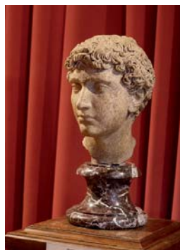
Портрет юнака (Рим, доба Антонінів, 138–192 рр., мармур)