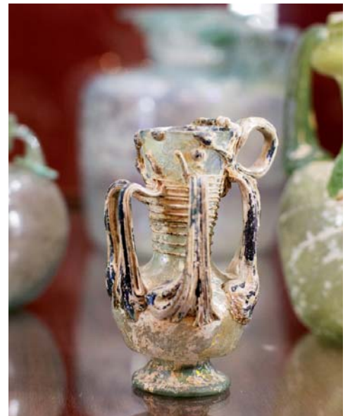
Античне скло (I–IV ст. н. е.)