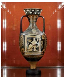
Амфора із зображенням жіночої фігури (Південна Італія, Апулія, IV ст. до н. е.)

Якщо ви й досі не побували на виставці «Антична колекція Музею Ханенків. Вибране», у вас ще є час, адже її продовжено до 15 квітня. Експозиція приурочена до 165-річчя з дня народження Богдана Ханенка та 100-річчя Фані Штительман – археолога, мистецтвознавця й дослідника давнього мистецтва. Тут представлені близько 60 творів мистецтва Давньої Греції, Етрурії та Риму з музейного зібрання, що зберігалися в запасниках. Вік найстаріших предметів становить понад 3 тисячоліття, а наймолодших – близько 1700. Серед експонатів – розписні вази, теракотові статуєтки, мармурові портрети, скляні флакони та келихи... У кожного з цих раритетів – власна історія, і кожен з них є частиною грандіозної мозаїки античної культури, випромінює величний спокій та гармонію. Більшість експонатів походять з колекції Богдана та Варвари Ханенків, решта передалися до музею впродовж XX століття з інших зібрань та археологічних розкопок.