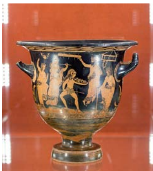
Кратер (Греція, Аттика, близько 400 р. до н. е.)