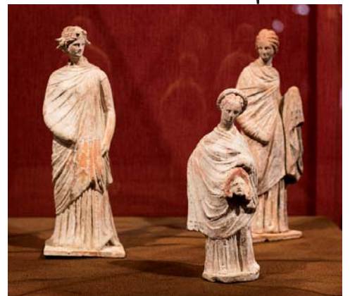
Теракотові статуєтки (Греція, IV–III ст. до н. е.)