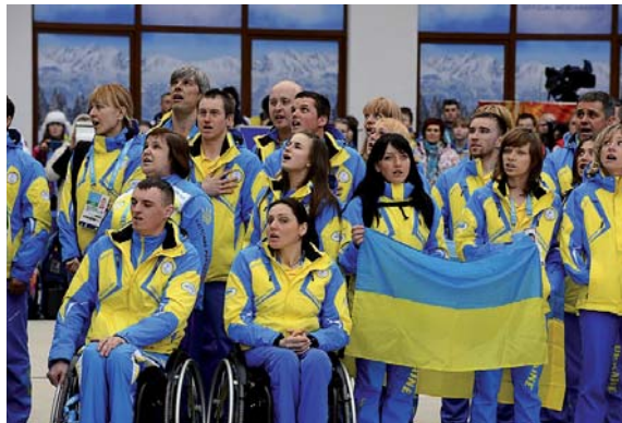
Паралімпійська збірна України

У вівторок в аеропорту Бориспіль уболівальники зустрічали національну паралімпійську збірну команду України – учасницю XI зимових Паралімпійських ігор у Сочі. Наші спортсмени вибороли 25 медалей, посіли четверте загальнокомандне місце і стали другими за загальною кількістю здобутих нагород.