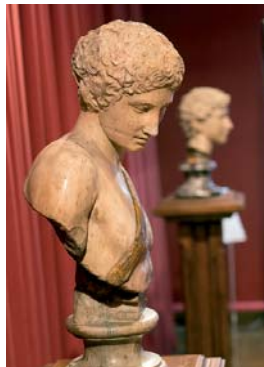
Атлет (Рим, II ст. за грецьким зразком)