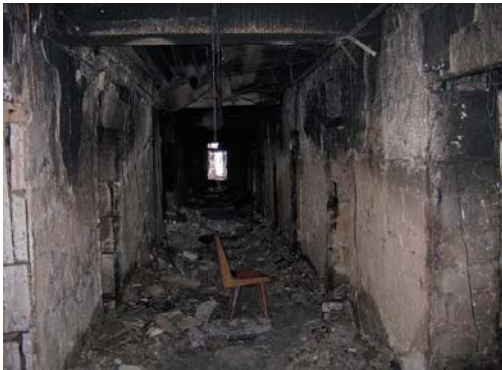
Це те, що залишилося від нашого Будинку профспілок