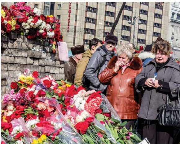
Жодна влада не варта людського життя...