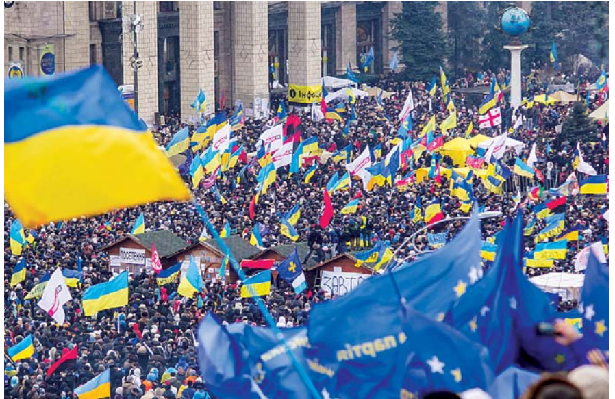
Один із вихідних, коли зібралися декілька мільйонів мітингувальників