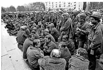
ня Донбасу. На хвилі страйків 19 червня 1993-го в Донецьку відбувся установчий з'їзд Комуністич-

Україна вже мала досвід проведення дострокових президентських виборів. У червні 1993 року на тлі важкої економічної ситуації розпочався страйк шахтарів Донбасу. За кілька днів він переріс у загальний протест підприємств Донбасу. Протестувальники висували не тільки економічні, а й політичні вимоги: зокрема, налагодити стосунки з Росією та надати більш широкі повноважен-