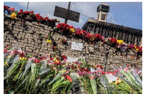
Квітами засипали барикади, де пролилася кров