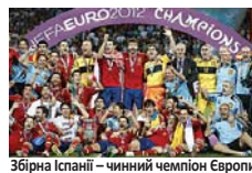
Збірна Іспанії – чинний чемпіон Європи

яка продемонструє найкращий результат серед колективів, які посіли третє сходинки у своїх групах. Решта тих, хто став третіми, у стикових матчах визначають останніх фіналістів, які долучаться до збірної – господаря змагань. Судячи із складу учасників групи «С», нашим співвітчизникам цілком до снаги пробитися до вирішальної стадії наступного континентального турніру, оминувши згубні для нас матчі плей-оф. Як підтвердив відбір на цьогорічний фінальний турнір світової першості в Бразилії, прокладати двобойні на вибування збірна України досі так і не здолала. Оцінку суперникам і шанси наших футболістів у відборі до Євро-2016 «ПВ» представлять читачам в одному з найближчих номерів, а поки пропонуємо вашій увазі склад усіх груп кваліфікаційного раунду та розклад ігор збірної України.