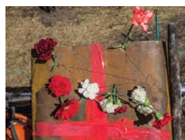
Верхні отвори, де вставлені квіти, це отвори від куль снайперів. У того, хто був за цим щитом, шансів не було