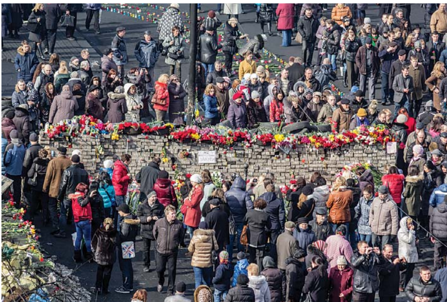
Прощання із загиблими

Те, що сталося у нашій країні цієї зими, запам'ятається надовго всім небаайдужим – чи то українцям, чи чужоземцям. Починалося все мирною ходою-протестом, на яку донедавна мали право всі громадяни. Саме в такий спосіб кожен міг висловити власну точку зору, протест проти несправедливості, однак закінчилося це жорсткою загибеллю ні в чому не винних людей. Час покаже, чи були ці жертви марними, а чи стали початком змін у правильному напрямку. Однак сьогодні можна впевнено сказати: саме вони змусили змінити ставлення кожного з нас до уряду та всього, що відбувається навколо.