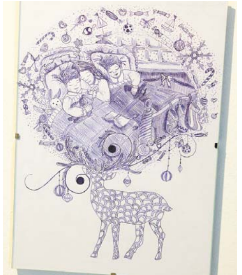
Новорічний олень з іграшками та смаколикami для малят

З 25 грудня до 14 січня у Карась Галереї тривала дивовижна експозиція «Художники малюють». На виставці представлені роботи, виконані на білому офісному папері А4 простою кульковою ручкою. Участь у цьому проєкті взяли як професійні художники, так і аматори. Все, чим вони скористалися, це кулькова ручка, аркуш паперу і... трохи фантазії. Що з цього вийшло – організатори проєкту запросили усіх охочих побачити на власні очі. За підсумками виставки найвдаліші роботи учасників буде внесено до окремого каталогу. Примірники видання передадуть до музеїв і бібліотек по всій Україні. Крім того, передбачається, що згодом будуть започатковані окремі проєкти учасників цієї незвичайної виставки.