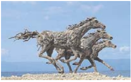
Отже, настав рік Синього Дерев'яного Коня. Щоправда, для нас із вами він настане лише

31 січня, та це не так важливо. Чому Синього, слід, мабуть, спитати в китайців. А от щодо Дерев'яного... Тут є цікавий привід для розмови. На Філіппінах живе скульптор британського походження Джеймс Доран-Уебб, який дуже майстерно виготовляє скульптури тварин з корчів та переробленого металу. Своє дитинство, зазначає kulturologia.ru, він