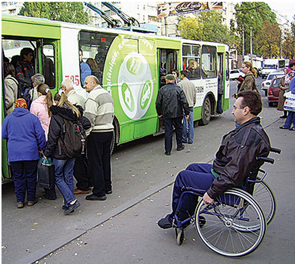
Люди з обмеженими можливостями почуваються на узбіччі. Їх доля цікавить хіба що рідних, суспільство до них збайдужіло