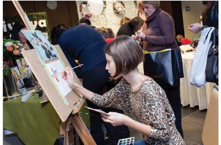
Діти малювали й захоплювалися цікавими іграшками та іграми