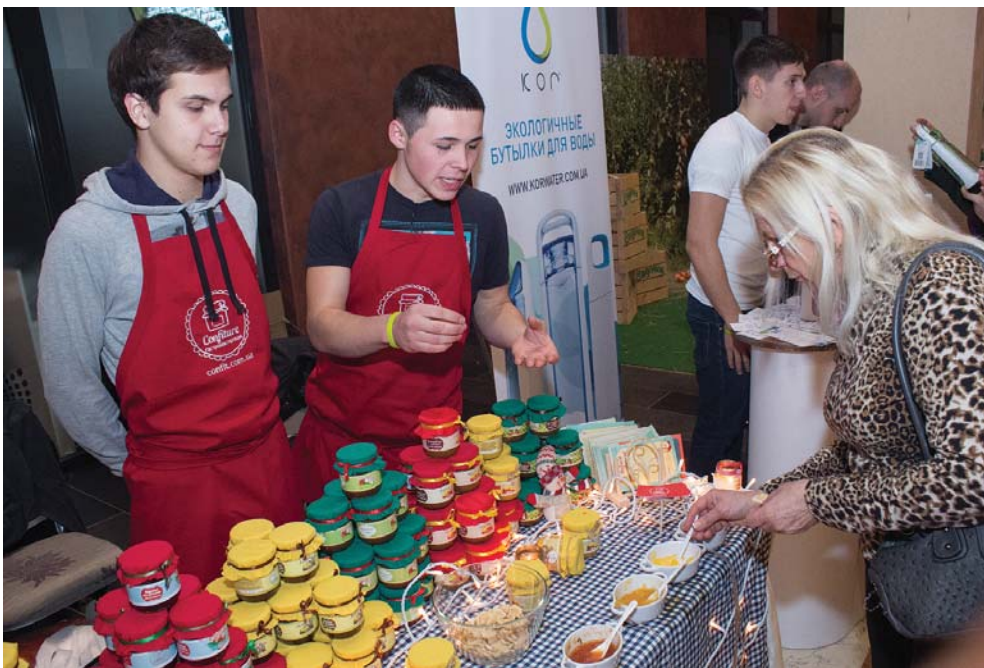
Що може бути краще за смачне варення? Тільки його кількість

З 8 по 9 грудня у Києві вже втретє проходив фестиваль їжі Best Food Fest & Health.