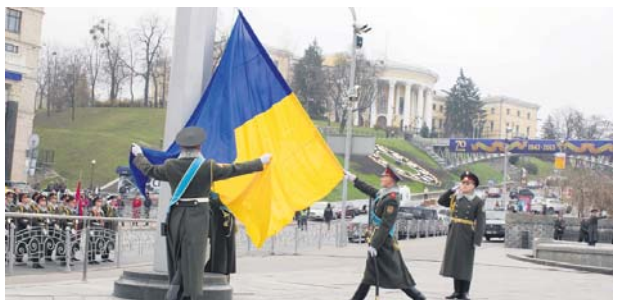
Підняття Державного Прапора України