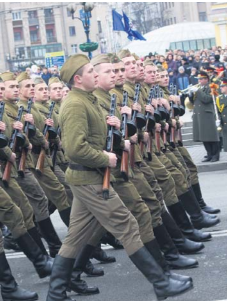
Військова техніка та солдати наче зійшли із старих фотографій