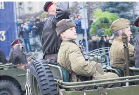
Юний учасник параду