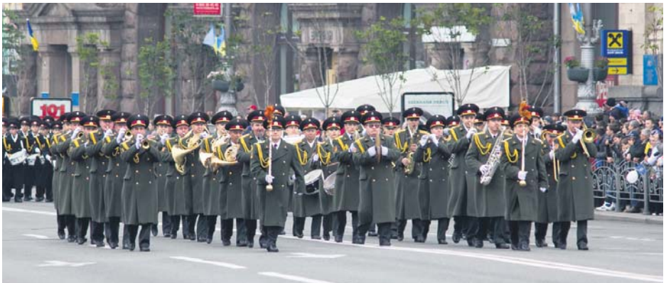
Оркестр виконує композицію часів війни