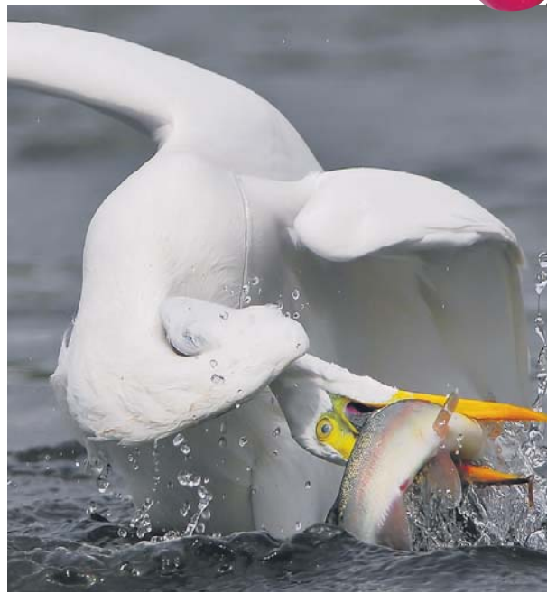
Як же ще тебе втримати?!

РИБИ Зосередьтеся на виконанні рутинної роботи, проте в жодному разі не працюйте абияк. Аби відволіктися від проблем, займіться домашніми справами.