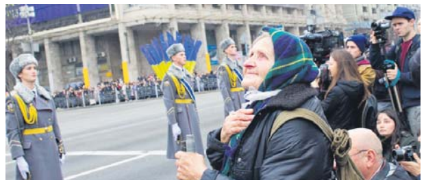
Лишилися тільки спогади...

Ті ж, хто прийшов подивитися на парад, побачили зразки старої бойової техніки та військових, одягнених у солдатську форму часів Великої Вітчизняної війни. Завершилося святкування концертною програмою та гучним феєрверком.