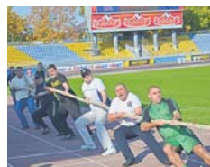
Чемпіони з перетягування канату – команда обласного бюро судмедекспертизи