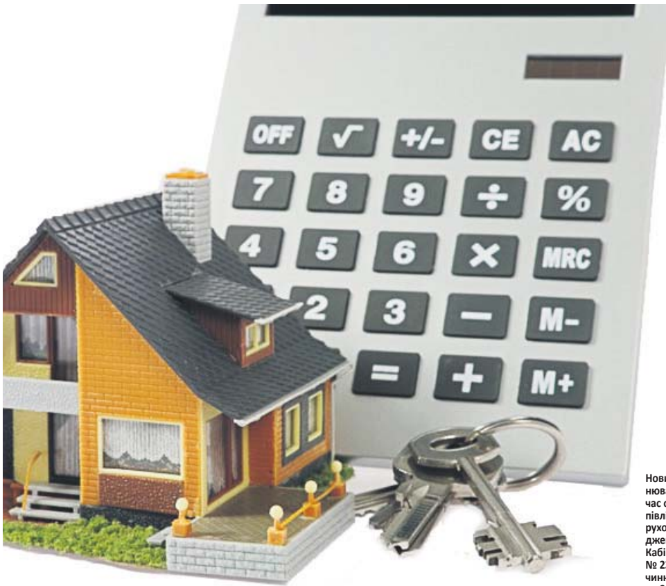
Новий порядок оцінювання майна під час операцій із купівлі – продажу нерухомості затверджено постановою Кабінету Міністрів № 231, яка набула чинності з 1 листопада 2013 року

Після оприлюднення інформації про нововведення у ЗМІ з'явилися повідомлення, у яких стверджувалося, що за новими правилами неможливо буде подарувати або отримати у спадок будинок чи квартиру. Представники Держслужби з питань регуляторної політики та розвитку підприємницької діяльності заперечують цю інформацію: мовляв, новації спрямовані на регулювання оподаткування купівлі – продажу нерухомості. Тож люди даруватимуть чи успадковуватимуть житло, як і раніше.