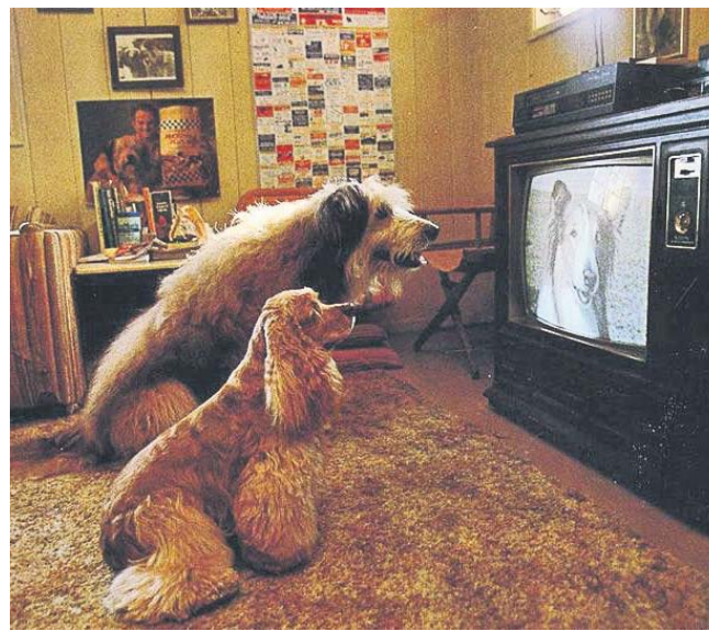
Яка може бути прогулянка, коли така цікава передача!..

РИБИ На цьому тижні вам доведеться мати справу з великими грошима.