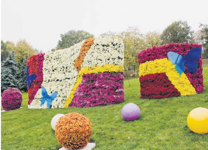
«Блакитне повітря» назвали свою інсталяцію Печерські квітникарі