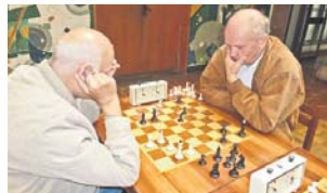
За шаховою дошкою