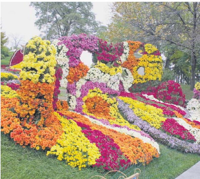
«Імпровізації на тему Гауді», квіти і дзеркала (Голосіївський район)