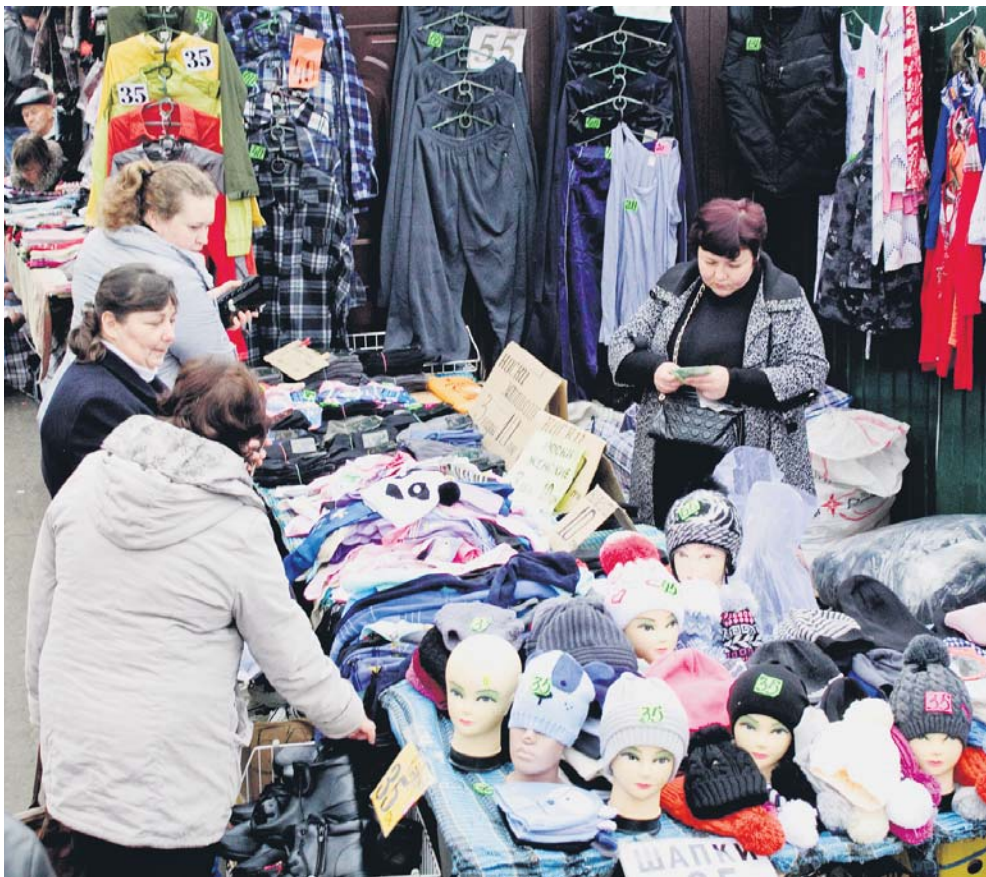
41% витрат тих, хто живе в злиднях, йде на продукти харчування, 29% – квартплату, 15% – ліки і 8% – одяг. Для бідних витрати на ліки та одяг становлять приблизно однакову суму – по 10%