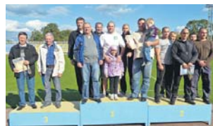
Переможці змагань сімейних стартів