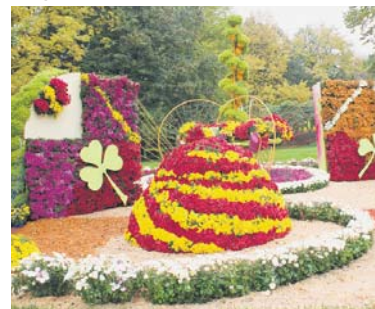
«Траєкторія настрою» (Оболонський район)