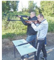
На вогневому рубезі

Певно, немає жодної області в Україні, де б профспілкова спартакіада мала понад 20-річну історію. А між тим, справжнім святом спорту і здоров'я стала XXIII обласна міжгалузева спартакіада профспілок Закарпаття, у фінальних змаганнях якої взяли участь 17 команд галузевих профспілок та профспілкових комітетів підприємств – загалом близько 450 учасників.