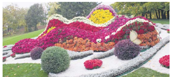
На гребені хвилі