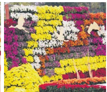
Композиція із хризантем «Журавлі» (Солом'янський район)