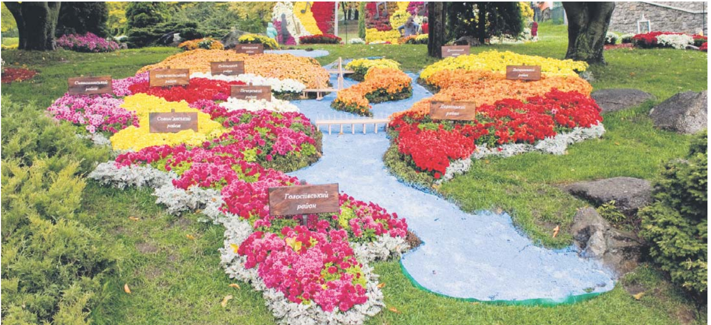
Карта Києва, виготовлена із квітів