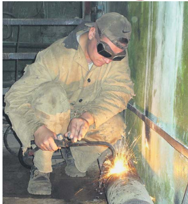
Якщо взявся за справу, то доведи її до кінця!

РИБИ Стикнетеся з непередбачуваними труднощами. Проте не варто на них зацілюватися, уверенно працюйте до своєї мети.