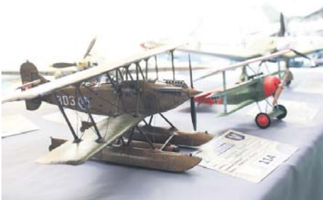
Одна з моделей літаків

На конкурсі панувала чудова атмосфера; дорослі, наче малі, із захопленням розглядали представлені моделі.