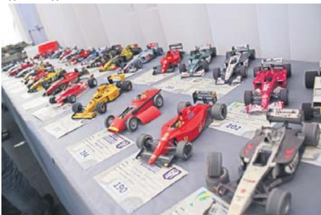
Прихильники швидкості мали змогу роздивитися відомі автівки