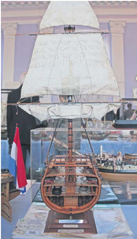
Хоч зараз заряджай гармату та стріляй