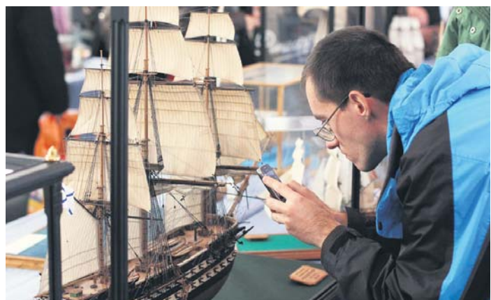
Діти й дорослі були в захваті