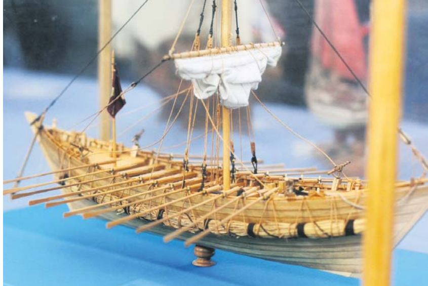
Дерев'яна модель відомої запорізької чайки