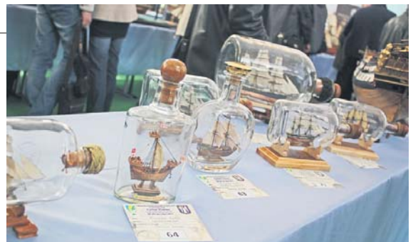
Пляшки, у середині яких розмістилися вітрильники