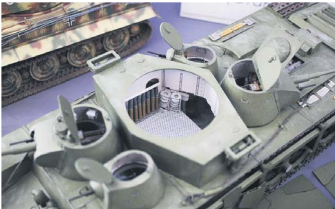
У середині моделі можна побачити навіть боєприпаси