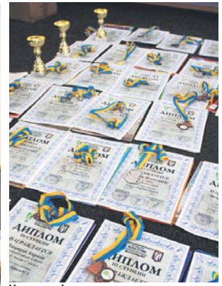
Нагороди і грамоти чекають на своїх переможців