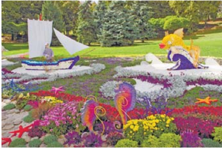
Морячок і золота рибка