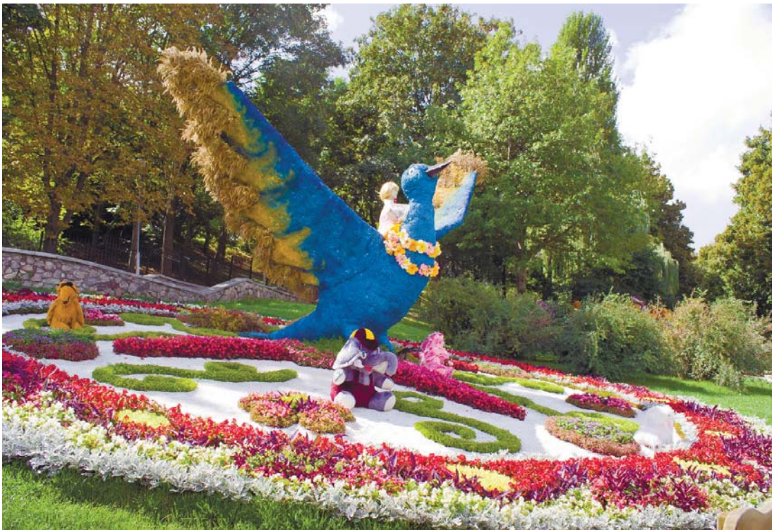
Синій птах дитячих бажань