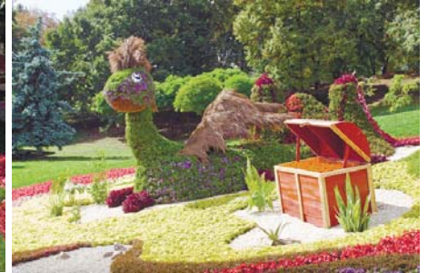
Із таким драконом кожен не проти подружитися