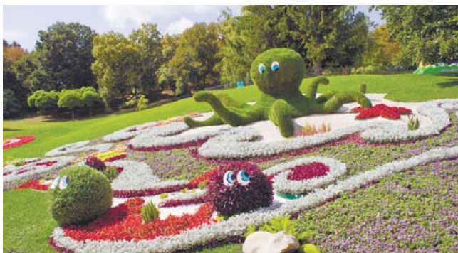
Від такого восьминога в захваті не тільки діти, а й дорослі