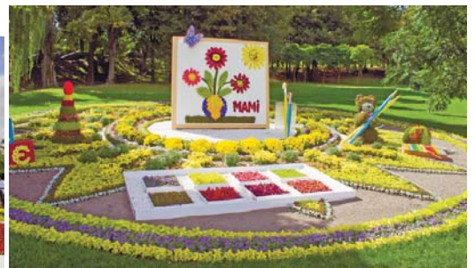
Ну як же без подарунка для матусі?..