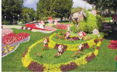
Казкові гриби, гноми і ягнятко