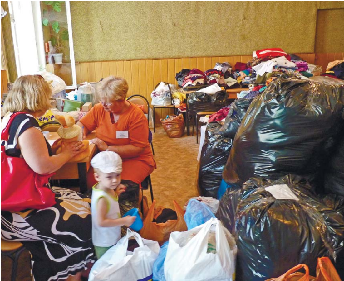
Цього року Україна отримала гуманітарну допомогу з 33 країн. Найбільше допомагають Німеччина, Польща, Нідерланди, Швейцарія, США

У 2012 році, за словами міністра соціальної політики, вартість ввезеної в Україну гуманітарної допомоги сягнула 57 мільйонів доларів США.