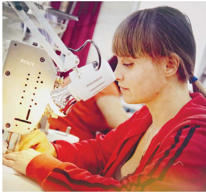
Залізна машина + ніжна людина = гармонійний дует...

РИБИ Не соромтеся приймати несподівані рішення. Змінивши своє ставлення до роботи, ви отримаєте вражаючий результат.