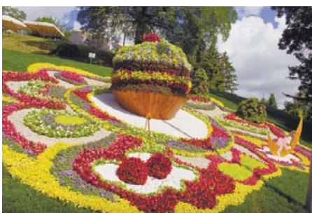
Солодощі подобаються всім дітям, особливо якщо вони величезних розмірів

Відвідувачі виставки мають змогу помилуватися повітряною кулею, що прямує в світ знань, добрим драконом, що охороняє небачені скарби, чарівним лісом, в якому мешкають гноми, а також тістечками та цукерками з квітів. Є й експозиції, що нагадують про улюблених казкових героїв – Незнайку, Золоту рибку, Чарлі та шоколадну фабрику тощо.