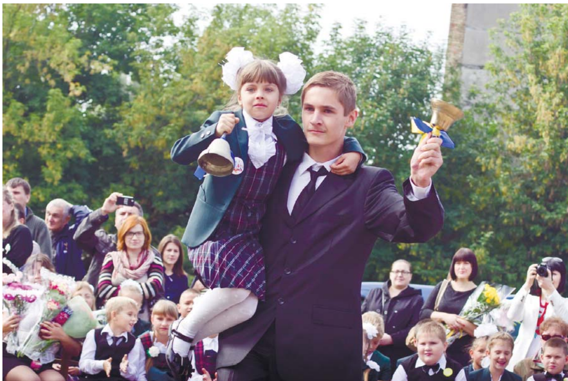
Саме та мить, коли розумієш, що навчальний рік уже розпочався