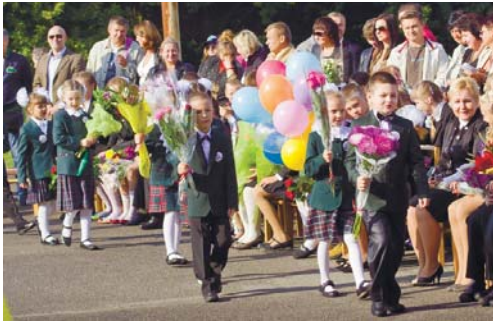
Упевнено крокують першокласники до Країни знань