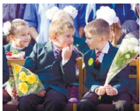
«Поглянь, у мене жуб учора випав...»

Тож нехай святковий настрій першOVERесня залишається надовго. Бажаємо школярям наполегливості у здобутті знань, а педагогам – творчих звершень і перемог!