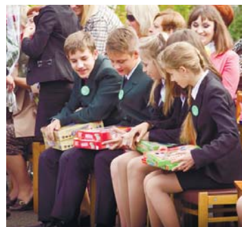
Не обійшлося без подарунків!