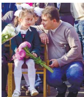
Батьківське напутнє слово