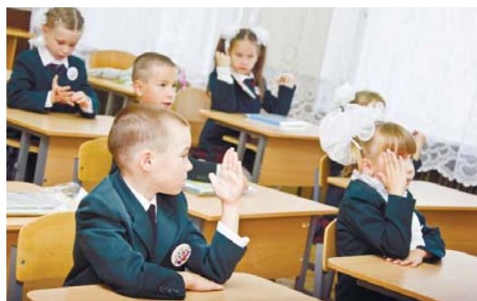
Перший урок, і діти вже ставлять перші запитання своїй першій учительці... Та через кілька уроків запитання вже ставитиме вона