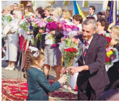
Найщиріші побажання вам, наставники!