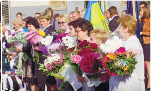
Учителі купалися у квітах