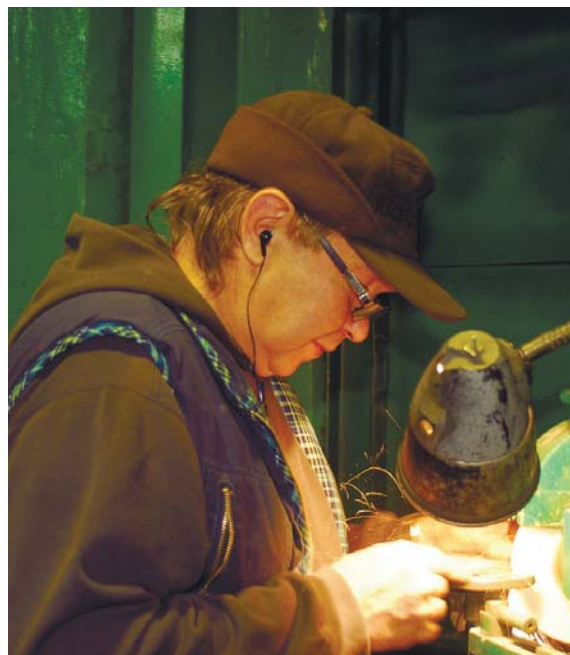
Скрізь є свої фахівці

РИБИ Унікайте емоційних розмов із родичами. Не дозволяйте іншим втручатися у ваше особисте життя і давати поради.