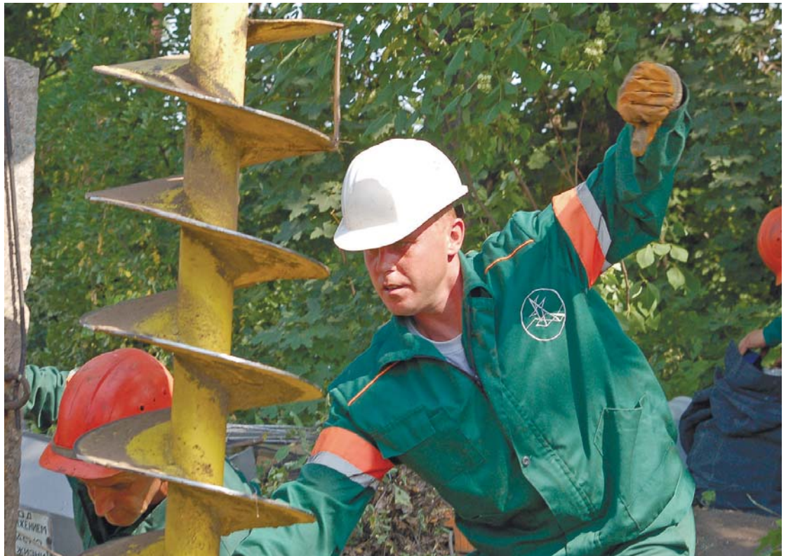
Фото Володимира АКСЬОНОВА, м.Мерефа, Харківська обл.

ТЕМА НОМЕРА | КОМУ НЕ ВИГІДНИЙ ТРУДОВИЙ КОДЕКС?