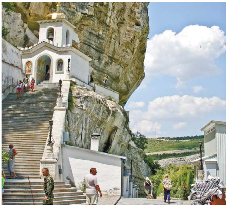
Форос – місто-санаторій