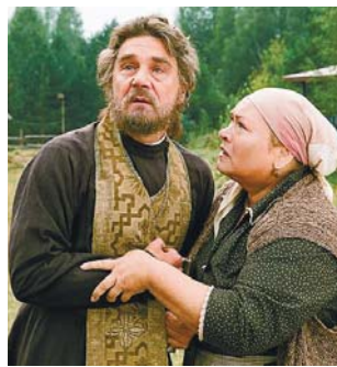
Отець Олександр, фільм «Папа»

Знаю це, й однаково не можу стриматися, коли йдеться про творчість народного артиста Росії Сергія Маковецького: він – геніальний актор! Глядач не завжди розуміє, яку неоцінену роль (перепрошую за контекстний каламбур) відіграє психофізика артиста у створенні ним того чи іншого образу. Втім, це стає зрозумілим, коли, приміром, дивившись один і той самий спектакль з різним складом виконавців або коли у фільмі одного актора замінюють іншим. Одне слово, хоч яку б роль Сергія Маковецького не пригадати – у театрі (ім. Є. Вахтангова) чи в кіно, щоразу з подивом переконуєшся, що саме ця роль написана не під нього й не для нього, а про нього. Й розумієш, що тут уже належить казати про унікальну базу – тричі талант, багатющій внутрішній світ актора, тонку нервову організацію, усвідомлений життєвий досвід, ідеально точну інтуїцію, пластичну й інтонаційну свободу. Адже що не образ – він волєнс-ноленс лишається в пам'яті глядача як неповторна, тобто глибоко індивідуалістична, особистість, вихоплена із самого життя!