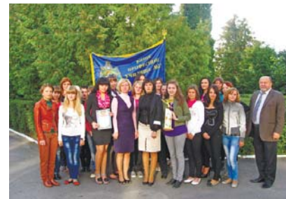
Краща група випускників – секретарі керівника, оператори комп'ютерного набору

Металурги сподіваються, що їхні заклики про врегулювання ситуації почувуть. Водночас вони заявляють про готовність – у разі ігнорування керівництвом заводу їхніх вимог – вдатися й до інших заходів (у тому числі масових акцій) у межах чинного законодавства.