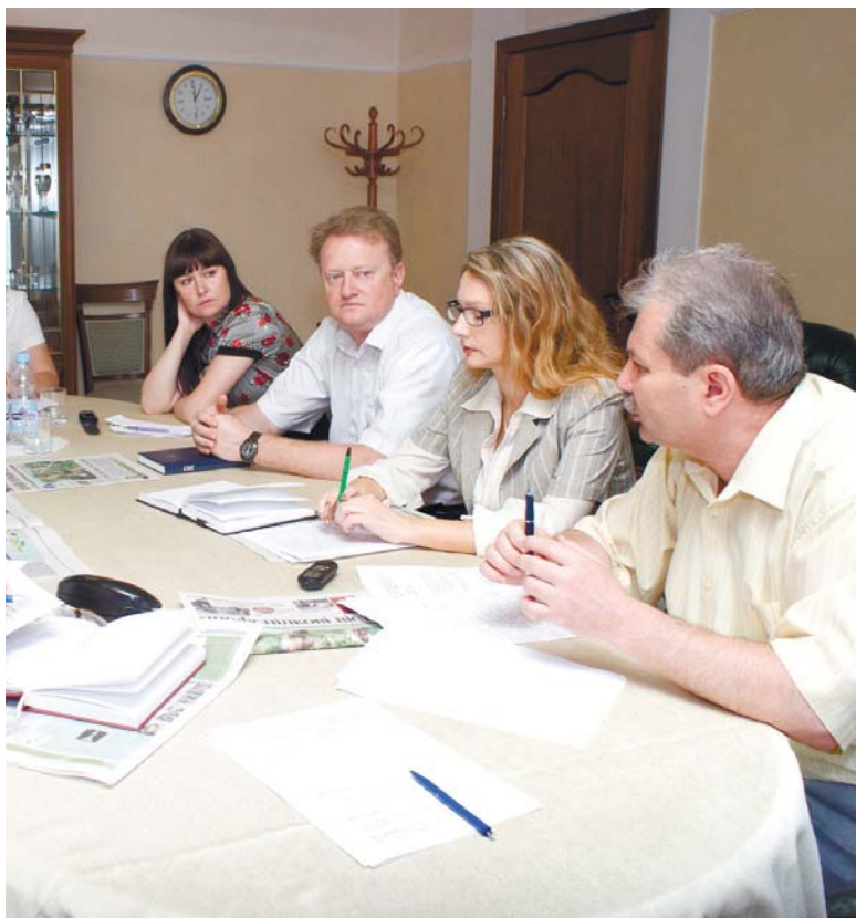
Засідання круглого столу