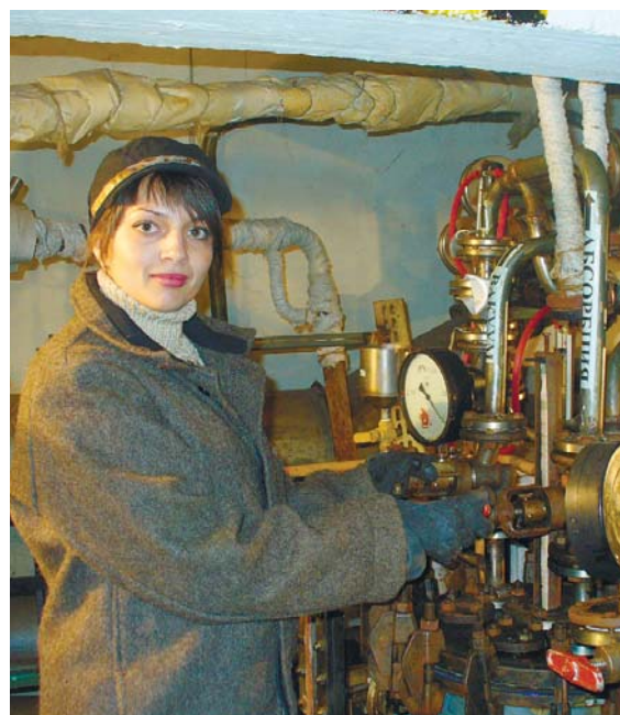
Об'єднана профспілкова організація хімічних заводів

РИБИ Вам давно складно знайти спільну мову з оточуючими. Постійне невдоволення і дратівливість можуть зіпсувати стосунки з колегами.