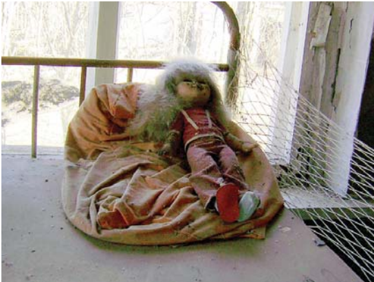
Копачі – найближче до атомної станції село, розташоване між Прип'яттю і Чорнобилем. Після аварії всі будівлі села були поховані на місці. Вцілів лише дитячий садок, де лялька й досі чекає на повернення своєї господині