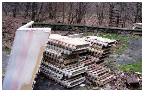
Біля будівлі медсанчастини штабелями лежать чавунні радіатори теплоцентралі