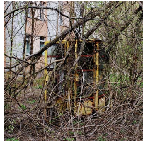
Повічені телефонні будки та зламана поштова скринька, листи з якої так і не дісталися адресатів...