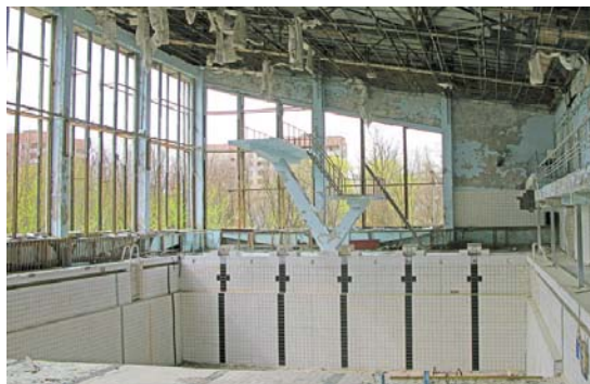
Усі великі вітражні вікна в БК «Енергетик», у басейні та магазинах вибито мародерами через алюмінієві рами. Іноземні туристи, відвідуючи це місто, впевнені, що всі руйнування є результатом ударної хвилі після вибуху реактора