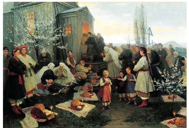
Микола Пимоненко. Пасхальна затуреня в Малоросії. 1891

В українців свято Воскресіння називається Пасха або Великдень. Слово «Пасха» апелює до ще старозаповітного свята «песах» (у перекладі «переходити», «позбавляти», «милювати»), що його відзначали іудеї на