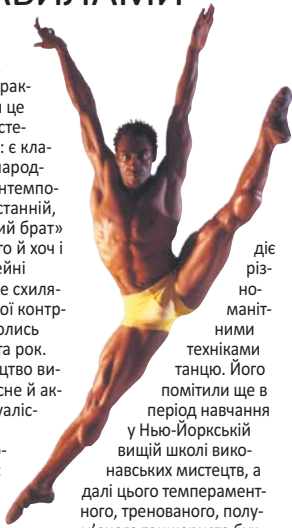
діє різноманітними техніками танцю. Його помітили ще в період навчання у Нью-Йоркській вищій школі виконавських мистецтв, а дали цього темпераментного, тренованого, полум'яного танцюриста буквально «розривали на частини» всесвітньо відомі трупи й театри. Коли 1997 року він увійшов до складу Американського театру балету й виконав головну партію у міжнародній прем'єрі балету «Отелло», газета «Нью-Йорк таймс» написала, що Річардсон – «один з найвеличніших артистів, котрі виходили на сцену Метрополітен-Опера».

Так чи приблизно так можна охарактеризувати це танцювальне мистецтво. Або інакше: є класичний балет, є народний танець і є контемпорарі-денс. Цей останній, схоже, «молодший брат» балету класичного й хоч і успадкував «сімейні риси», але більше схиляється до так званої контркультури, як от колись догвоволосі хіпі та рок. Контемп – мистецтво ви-клику, воно сучасне й актуальне, індивідуалістичне, навіть імпресіоністично-екзистенціальне: я у цьому світі, мій поривання, мій екстаз, мої відчуття.