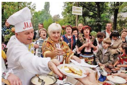
Міжнародний фестиваль дерунів у Коростені

сало. Найбільш, сказати б, виразний пам'ятник, здається, у Росії, в м. Маріїнську Кемеровської області, на батьківщині світового, досі ніким не подоланого, рекордного врожаю. Цей пам'ятник було відкрито 2008 року, який ООН саме й оголосила Міжнародним роком картоплі.