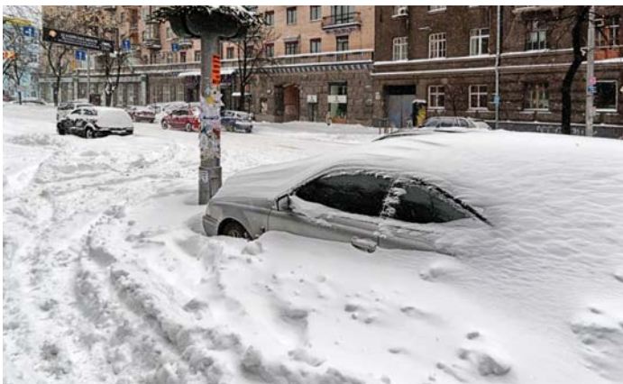
Автівку, що її залишив власник на узбіччі, неможливо помітити у сніговому заметі