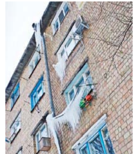
З дахів будинків на перехожих чатують небезпечні бурлульки

Останні тижні чи не найактуальнішою темою розмов українців є рекордний за останні сто років снігопад, який просто паралізував країну. Із п'ятниці по неділю, 23-25 березня, негода спричинила транспортний колапс у столиці. Численні затори на дорогах через снігові замети, нерозчищені дороги, залишені у корках авто перетворили широкі магістралі в одно- й двополосні проїжджі частини. Терпець уривався багатьом водіям автовок, вони у розпачі залишали своїх «залізних коней» у корках, а вранці розкопувати їх зі снігових заметів. Місцеві комунальні служби не могли впоратися зі стихією, навіть попри залучення військової техніки. Після додаткового вихідного дня у вівторок ситуація не поліпшилася. Найскладнішою, що ледь не спричинила паніку, виявилася ситуація поблизу центрального залізничного вокзалу та на усіх дорогах, що прямували у центр міста. Порушення графіка руху поїздів спричинило ажіотаж біля квиткових кас. Уємішку викликали кияни, які рухалися Хрещатиком на лижах. Зараз, коли снігопади минули й настає довгоочікувана весна, мешканці Києва занепокоєні, чи не затоплять столицю талі води? Це доволі болюче питання, адже купи снігу на тротуарах починають танути, ріки води течуть під ноги перехожим, зливні стоківі решітки забиваються брудом, льодом і снігом. Тож будьмо пильними, не гарячкуймо у дорозі, допомагаймо тим, хто цього потребує, та сподіваймося на краще!