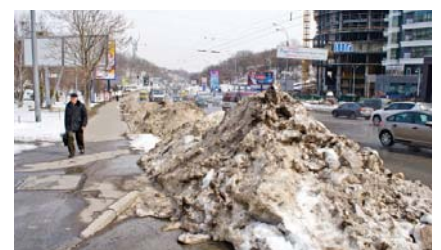
Невивезений сніг на узбіччі може затопити проїжджу частину