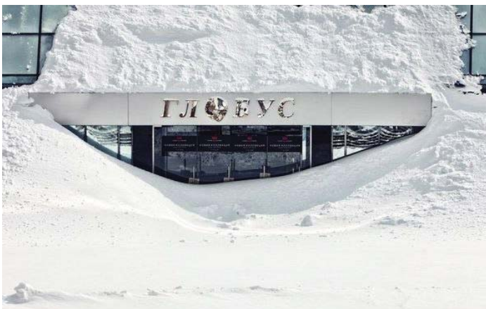
Центр столиці не впізнати і легко сплутати з Північним полюсом