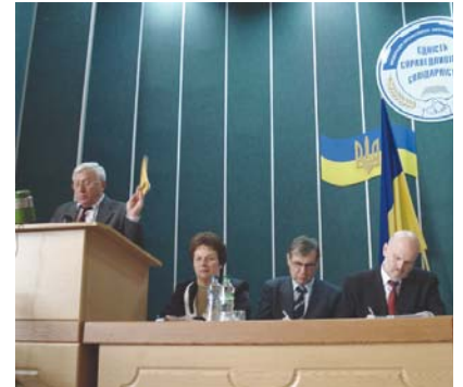
Прем'єр-міністру України Азарову М.Я.