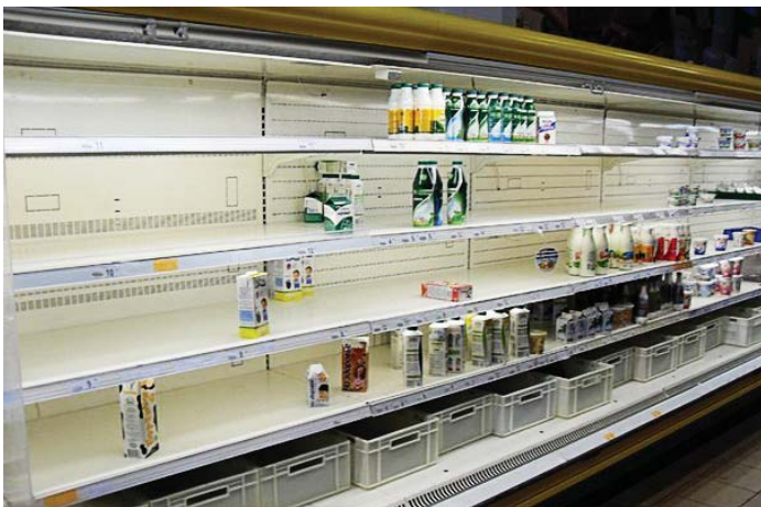
Полиці магазину майже пусті, усі продукти розхпали, а нові неможливо підвезти через заметілі й затори