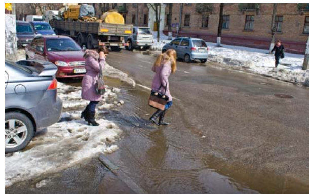
Забиті снігом зливні решітки перешкоджають потраплянню талі води у каналізацію. Відтак вулиці перетворюються на річки