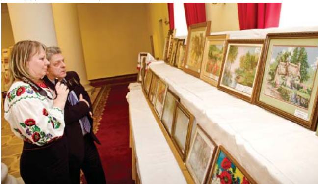
Вишиті картини зачаровують своїми барвами